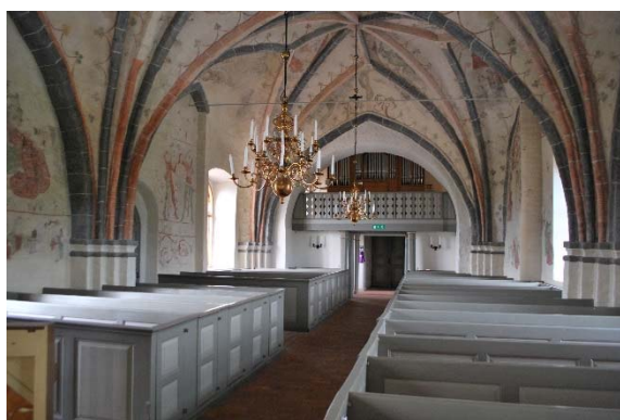
Långhuset mot väster.