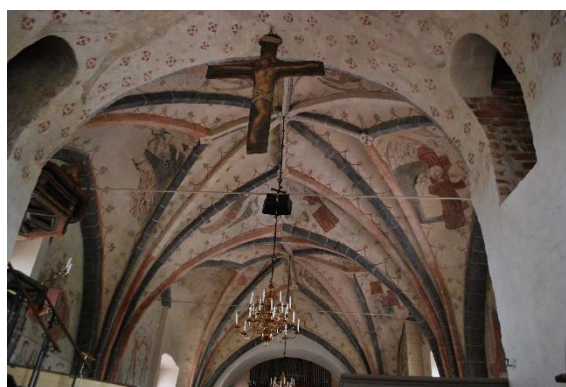
Triumfbågen med kalkmålning och öppning till trappor

Koret är i samma nivå som långhuset och golvet belagt med samma sorts tegel som i