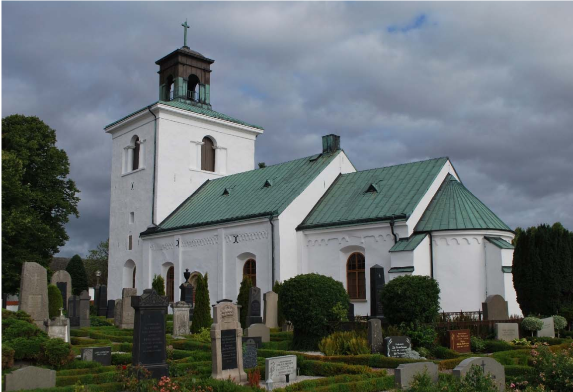
Fasad mot sydöst.