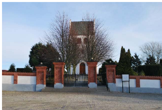
Entré från väster.