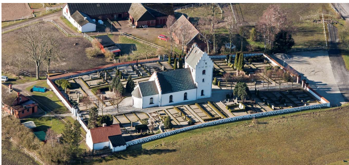
Från nordöst.

Lantbrukare är den vanligaste titeln på kyrkogården men havets närhet märks i titeln ”kustöveruppsyningsman”. Hans stora familjegrav har en stensarkofag och gravsten krönt av en ängel omgärdad av en stenstaket. Kyrkogården har en mängd stora vintergröna buskar men inga träd förutom allén längs mittgången på västra och östra sidan.