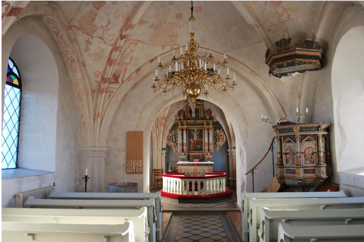
Långhuset mot koret i öster.