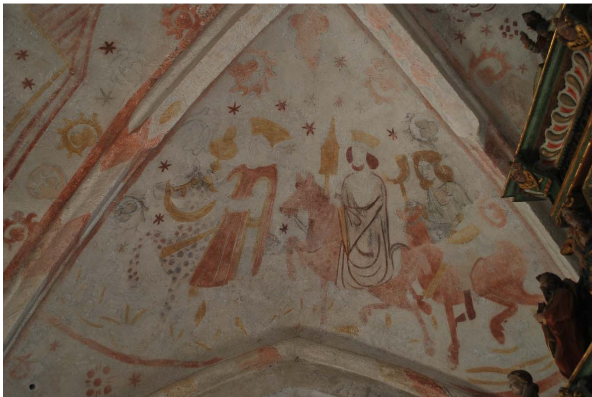
Konungarnas tillbedjan. Kalkmålning i koret från slutet av 1400-talet.

Triumfbågen mellan långhus och kor är rundbågig och smal med en omfattning av medeltida oputsade kritstenskvadrar. Lagningen från 1960-talet i nedre norra delen är gjord av sandstenskvadrar. En senmedeltida lagning på nedre delen på södersidan är av tegel som putsats och med fragmentarisk målning. Ett triumfkrucifix från 1200-talet hänger framför triumfbågen. Koret är välvt med ett spetsbågigt kryssribbvalv som vilar på tresprångiga pilastrar med kragband. Målningarna skildrar Maria bebådelse, Jesu födelse och konungarnas tillbedjan. Koret upptas av altaruppsats och altarring.