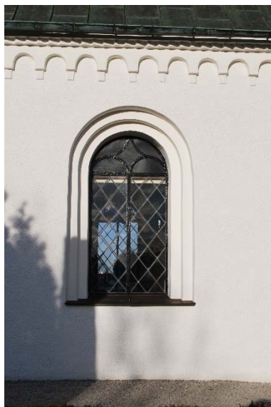
Fönster och takgesims.