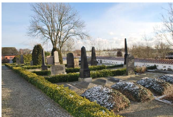
Södra delen av kyrkogården.