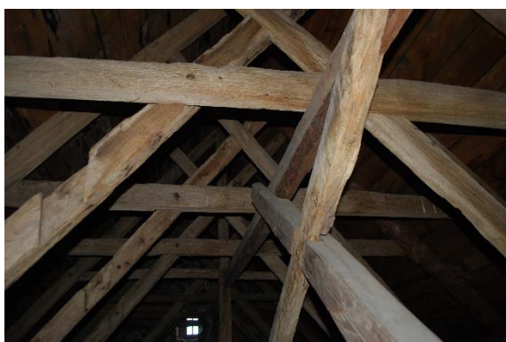
Taklaget över långhuset.

Vinden över kyrkorummet nås genom en lucka på andra våningen. Valven är oisolerade. Valvkapporna av halvstenstegel är ”toppiga”. Takstolen över långhuset är av medeltida bilat ekvirke samt återanvänd ek. Vissa delar har bytts ut mot furu. Den återanvända eken är mer välvuxen och slätare bearbetad än övrig ek. Takstolen består av sparrar, dubbla hanband, snedsträvor, saxsparrar och tassar samt en längsgående långstol. Tre av takstolarna (vid gavlarna samt i mitten) har en bindbjälke med kungsstolpe som förbinder långstolen. Taklaget i långhuset är förmodligen från tiden för valvslagningen på 1300-talet enligt antikvarie Petter Jansson som har bedömt taklaget. Vissa delar är återanvända och kommer troligen från långhusets ännu tidigare taklag.