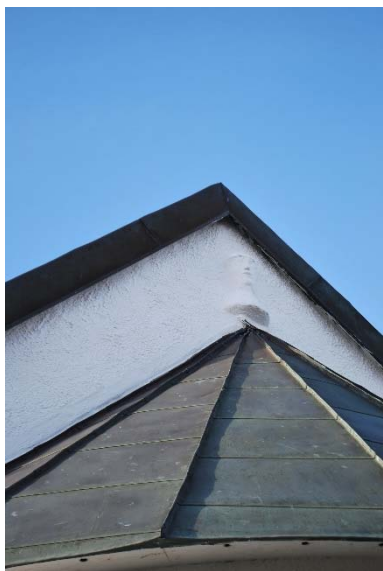
Manshuvud på korets östgavel.