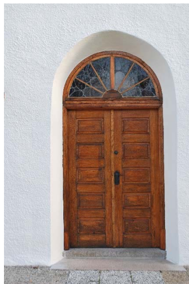
Entréport i tornet.

Kyrkan har tre ingångar, huvudingång genom tornet i väster, prästingång i absiden i öster och till vinden genom torntrappan. Alla ingångarna är sekundärt upptagna. Västingången togs upp 1834. Absidingången ersatte ett tidigare fönster. Både väst- och