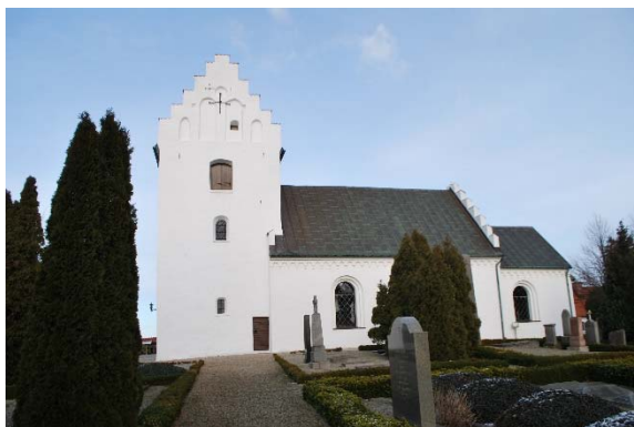
Fasad mot söder.

Tornet, från senmedeltid, är byggt av tegel murat i munkförband, sannolikt som skalmur. Det finns inslag av gråsten i nederdelen som delvis buktar ut. Tornets gavelröste mot norr och söder pryds med smala välvda slätputsade blindingar och har trappstegsgavlar avtäckta med tegel. Tornets norra fasad är den mest välbevarade medan övriga sidor är reparerade flera gånger enligt murverksundersökningen.