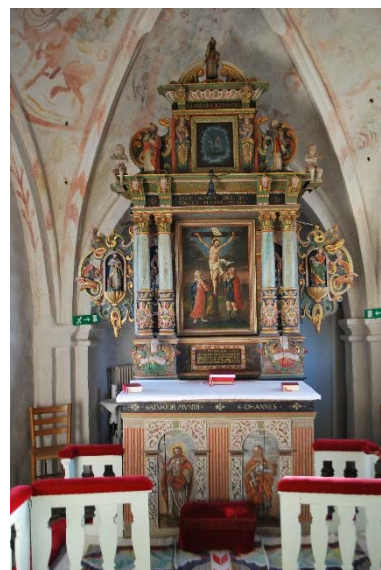
Altaruppsatsen i koret.

Predikstolen av bemålad rikt snidad ek är förmodligen från samma tid som altaruppsatsen i början av 1600-talet. Baldakinen tillkom 1735. Vid renovering på 1960-talet togs de ursprungliga färgerna fram och trappan tillkom samt korgen sänktes. Predikstolen var tidigare övermålad med ekådring. Korgens sidor har snidade bilder av evangelisterna inom rundbågiga fält under tympanonfält. Hörnen markeras av kolonnetter med änglar som står på maskaronprydda postament.