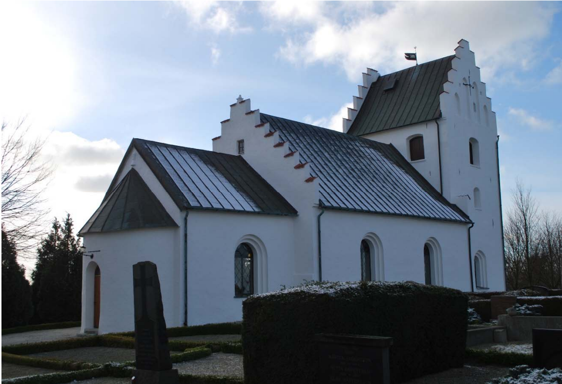
Fasad mot nordöst.