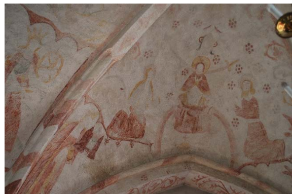
Yttersta domen. Kalkmålning i östra valvet i långhuset.

I valven hänger mässingsljuskronor. Valven är bemålade med sengotiska kalkmålningar från slutet av 1400-talet. Målningarna är delvis fragmentariska och bleka i ljust rött. Ursprungligen har målningarna varit flerfärgade. I västra valvet skildras skapelseberättelsen. I östra valvet visas bland annat yttersta domen med Jesus sittande på en regnbåge. Ribbor och bågar är målade med blixtmönster och växtbårder. Målningarna har vissa likheter med Östra Herrestads kyrka men är enklare utförda i Kyrkoköpinge. En målning i västra valvet med djävlar är i ett avvikande utförande från en annan period, men tidsmässigt närliggande. Ett litet fragment med målad bård från tidiggotisk tid före valvslagningen, enligt Banning, finns intill sydöstra fönstret i långhuset.