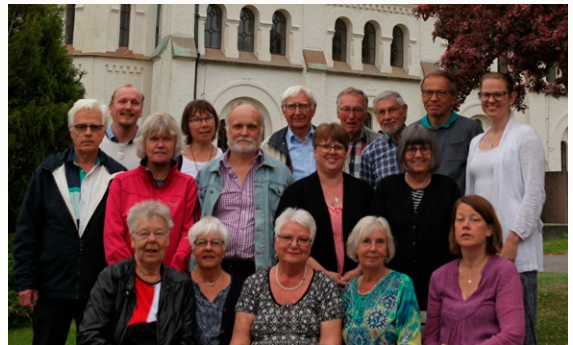
Kandidater från Samling för kyrkan.

Vi har många kandidater att välja på. Yngre och äldre, nya och några med många års erfaren-