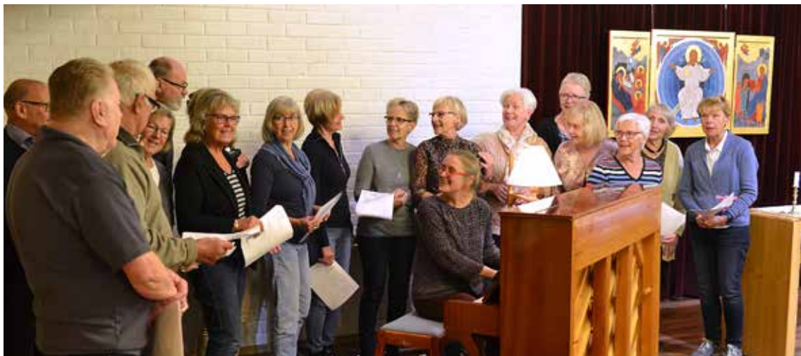
– Kom och sjung! Det finns plats för fler! Stämningen är hög när Våga-sjunga-kören träffas.