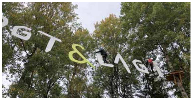
Våra ungdomar besökte högt och lågt i Karlstad. En spännande dag.