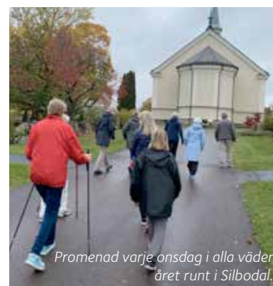
Promenad varje onsdag i alla väder året runt i Silbodals församling.

De har pratat med gruppen om vilken betydelse "promenaden" har och haft för dem. Alla är eniga om att de tycker det är en otroligt viktig social verksamhet. Att få komma ut och träffa människor och prata har varit extra viktigt i dessa tider. Några av deltagarna promenerar en del själva annars och tycker just samvaron därför är mycket viktig vid dessa träffar. Den enkla fikan efteråt fyller också en mycket viktig social funktion.