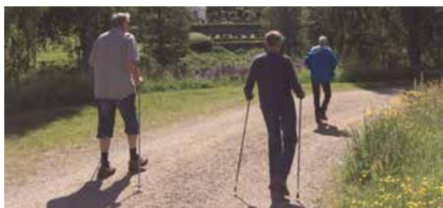
Varje tisdag året runt samlas Walk and talk vid församlingens hemmet.