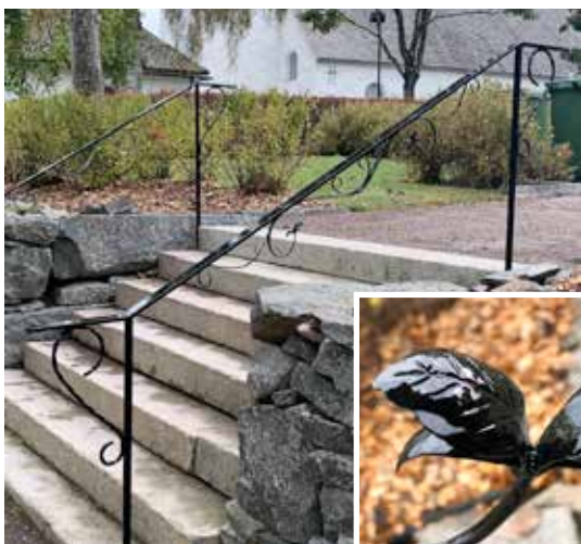
Karlanda kyrkogård har fått nytt räcke tillverkat av kyrkvaktmästare Ingmar Thorängen.