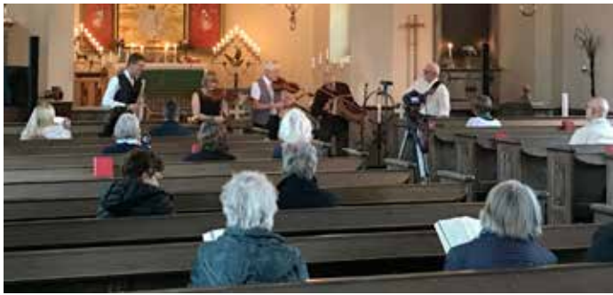
Skurvelua – folkmusikbandet från Arvika bjöd på en fin konsert i slutet av september i Blomskogs kyrka.