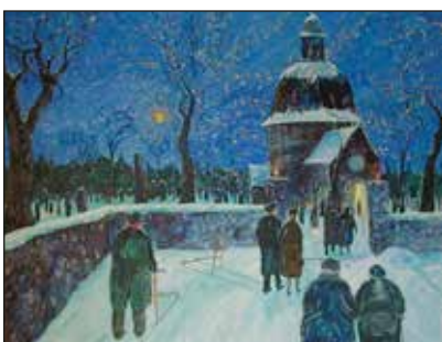
MÅLNING AV BO MATSON