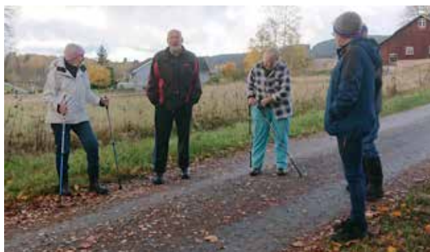
"På gång" på torsdagar i Östervallskog.