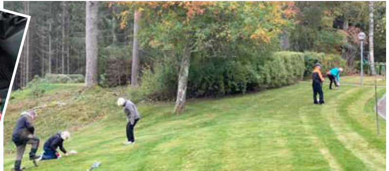
I Trankils församling hjälpte sju personer kyrkvaktmästaren att plantera ca 2000 lökar. Mycket uppskattat initiativ och det blir spännande att se resultatet när våren kommer.