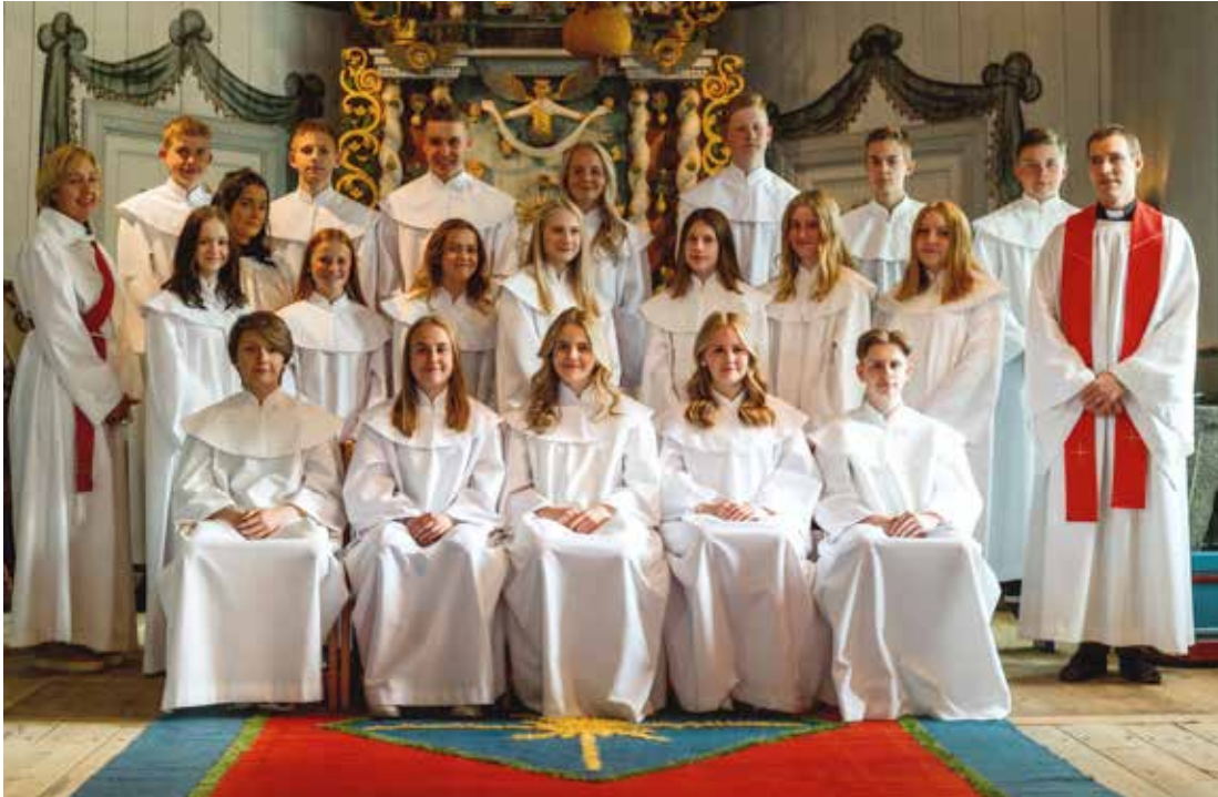
Konfirmationsmässan ägde rum i Västra Fågelviks kyrka den 25 oktober.