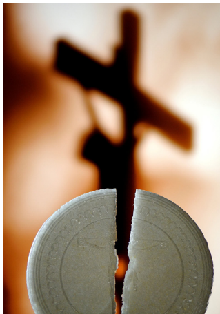
om inget annat anges