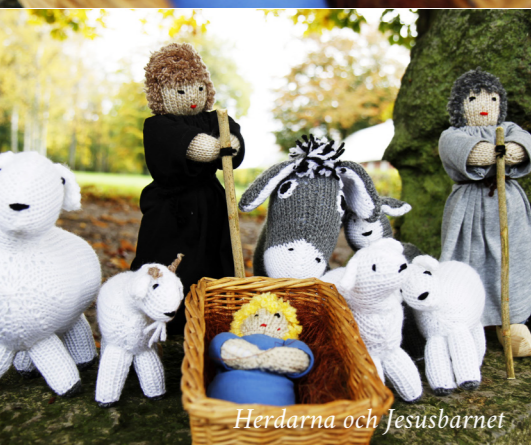
Herdarna och Jesusbarnet