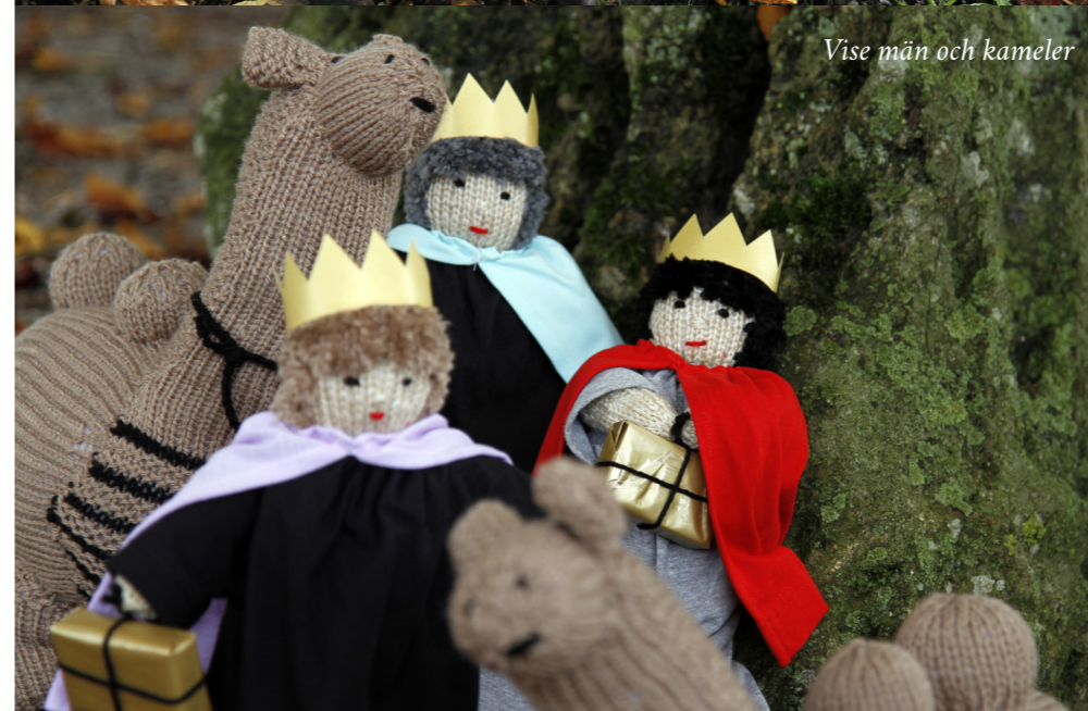
Vise män och kameler