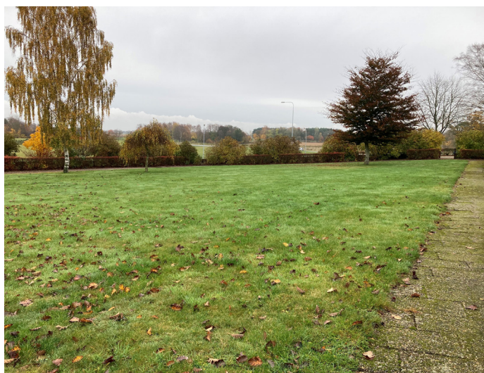
Lövestad nya kyrkogård mot nordost