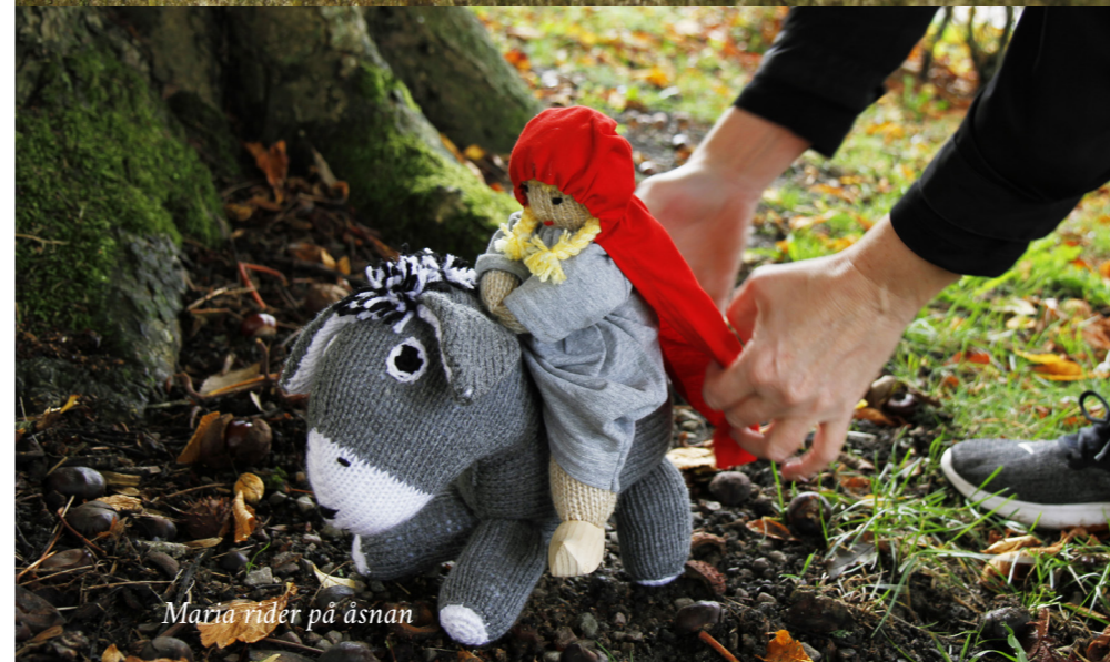
Maria rider på åsnan