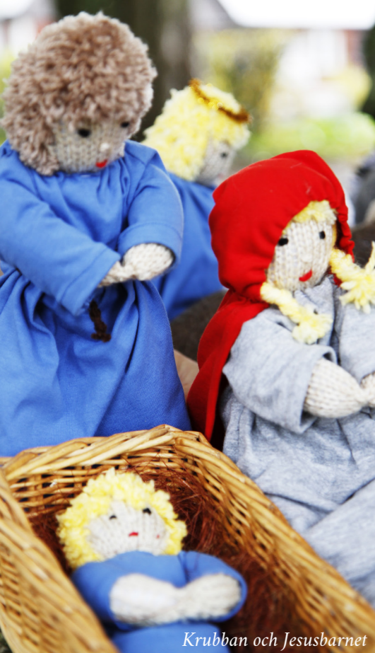
Krubban och Jesusbarnet