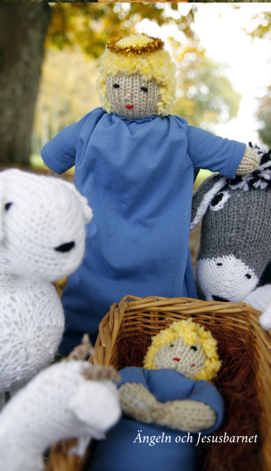
Ängeln och Jesusbarnet