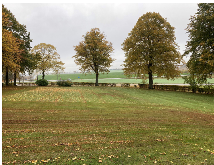
Röddinge kyrkogård mot norr