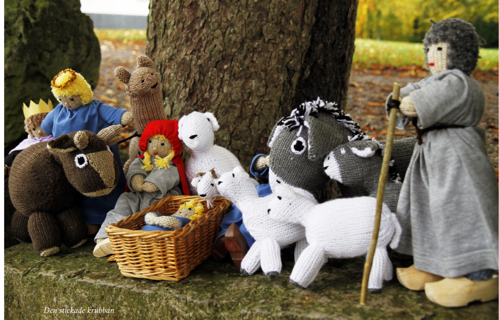
Den stickade krubban