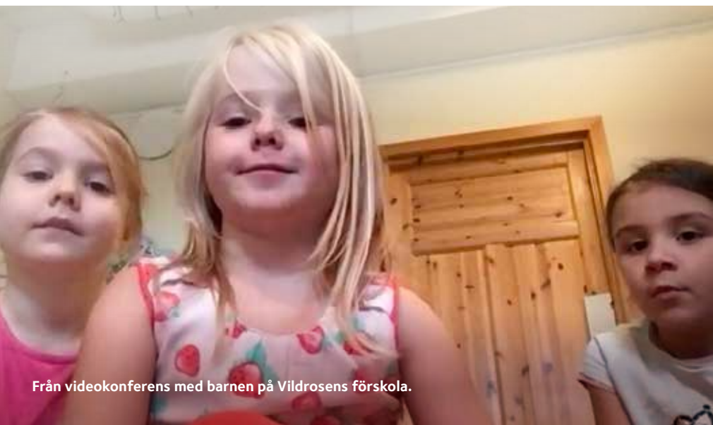
Från videokonferens med barnen på Vildrosens förskola.