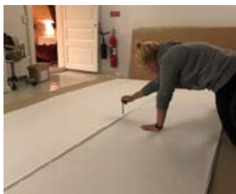
Kulisstillverkning till "Daniel i lejongropen"