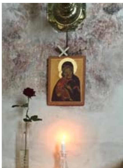
Maria ikon i Balingsta kyrka.

”Och ljuset kom in i världen och mörkret har inte övervunnit det” (Joh 1:5).