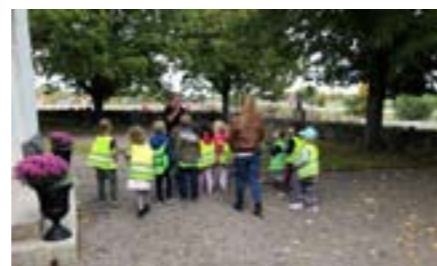
Skolbarn på besök i Ramsta kyrka.