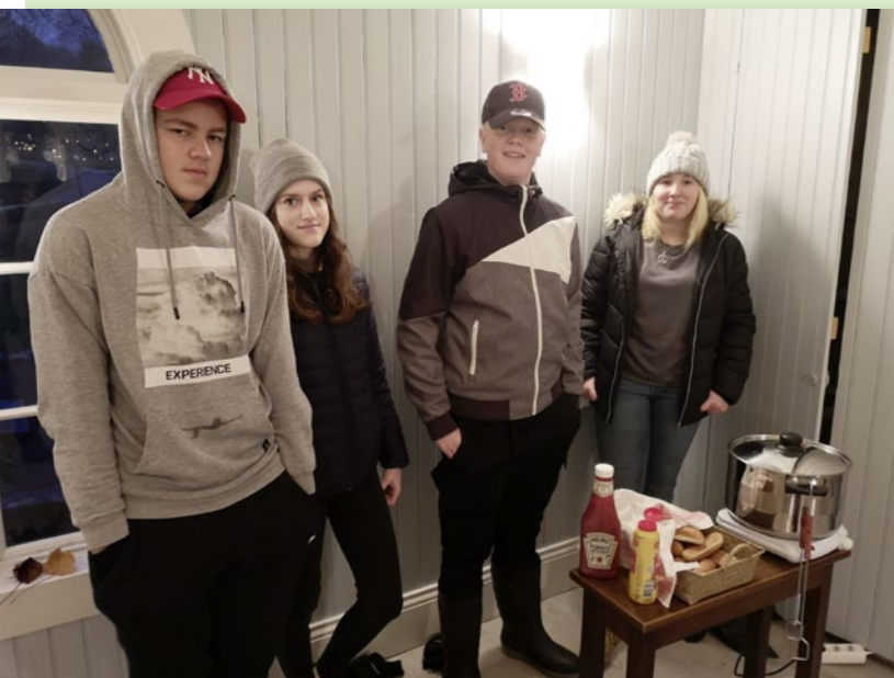
Konfirmanderna sålde korr och fika i gravkapellet på Alla helgons dag.

...när det var öppethus och pizzabakning i församlingshemmet under höstlovet! Du vet väl om att du kan hyra bagarstugan privat? Kontakta församlingsexpeditionen för bokning!