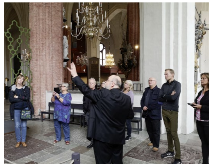
Personalen besökte under hösten Domkyrkan i Västerås och fick bl.a. en guidning av domkyrkokaplanen.

Under högtidliga former fick de äntligen komma fram till för att bli dubbade. Bjursås första riddare. Riddarskolan är ett samarbete mellan skolan och församlingen kring värderings och relationsämnen. Under läsåret har vi utbildat oss till moderna riddare som strider med kunskap, mod och insikt för sanning, frihet och rättvisa. Efter avslutad utbildning har årskurs 5 nu dubbats till de första riddarna av Bjursås sockensigill.