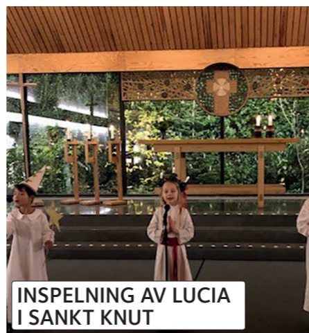
INSPELNING AV LUCIA I SANKT KNUT