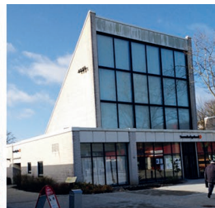
Samarbetskyrkan Sankt Knut Samarbetskyrka med EFS Linero Torg 12 224 76 Lund