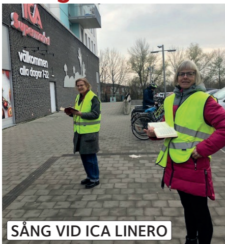
SÅNG VID ICA LINERO