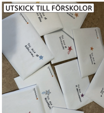
UTSKICK TILL FÖRSKOLOR