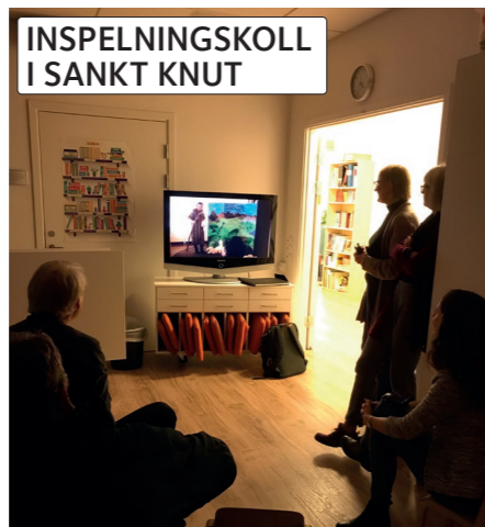
INSPELNINGSKOLL I SANKT KNUT