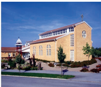
Maria Magdalena kyrka Flygelvägen 1 224 72 Lund