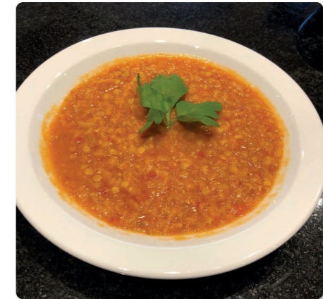
Linssoppa 4 portioner

4. Sätt ugnen på 225°C och sätt in frallorna mitt i ugnen när den blivit varm. Grädda brödet i ca. 15-20 minuter, tills de fått en gyllene färg. Tag ut och låt svalna innan du skär dem.