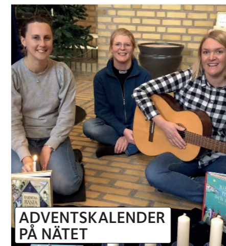
ADVENTSKALENDER PÅ NÄTET