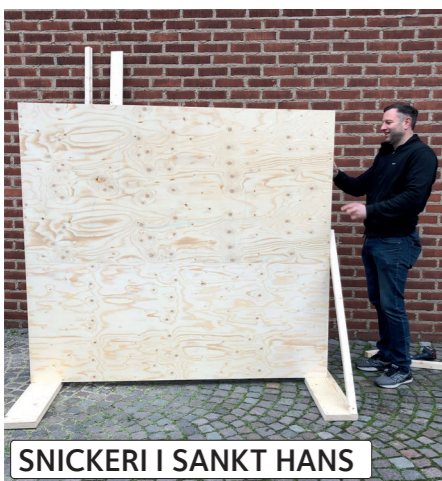
SNICKERI I SANKT HANS