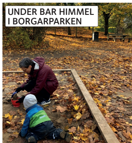
UNDER BAR HIMMEL I BORGARPARKEN