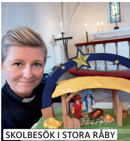
SKOLBESÖK I STORA RÅBY