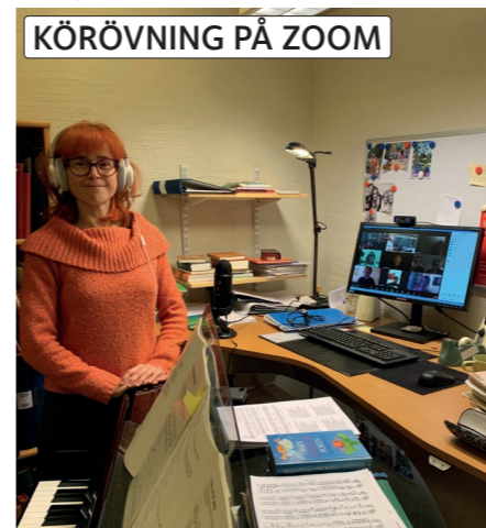
KÖRÖVNING PÅ ZOOM