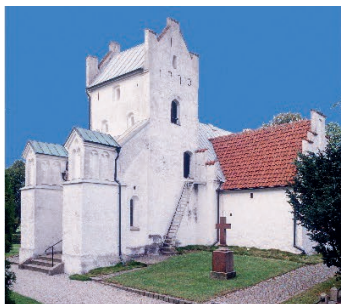
Stora Råby kyrka Stora Råby byaväg 7 224 80 Lund