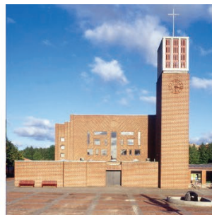
Sankt Hans kyrka Fäladstorget 32 226 47 Lund