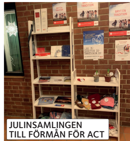
JULINSAMLINGEN TILL FÖRMÅN FÖR ACT