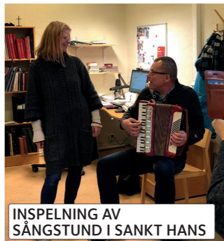
INSPELNING AV SÅNGSTUND I SANKT HANS