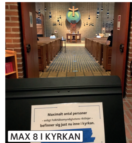
MAX 8 I KYRKAN