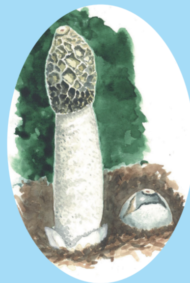
Stinksvamp (phallus impudicus) – Denna illaluktande svamp lever på multnande trä. De unga svamparna ser ut som ägg och brukar kallas för häxägg.