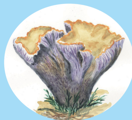
Violgubbe (Gomphus clavatus) – En sällsynt svamp som trivs i kalkrika gran- eller bokskogar.