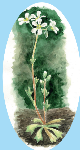
Hällebräcka (Saxifraga osloënsis) – En ovanlig ört som trivs på kalkrika berggrunder och jordar.

Till er som utnyttjar denna möjlighet för en stunds skön avkoppling önskar Uppsala stift att ni tar största möjliga hänsyn till den flora och fauna som finns i området.