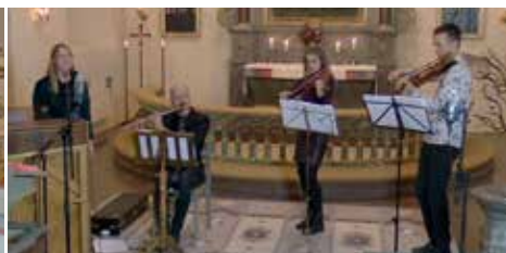
Mortorps kyrka 14/10; Gränsland