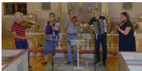
Karlslunda kyrka 16/9; Nybrobygdens spelemän