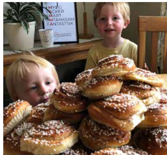
Byggsåg eller bullbak: Man får ha många kompetenser om man driver ett hem.