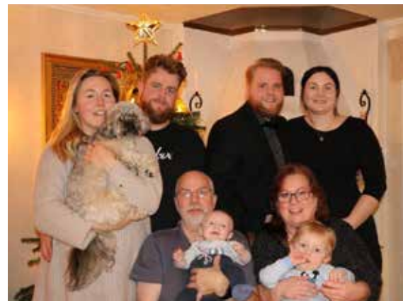
Två söner, två svärdöttrar och två barnbarn: "Familjeföretaget" har expanderat över tiden.