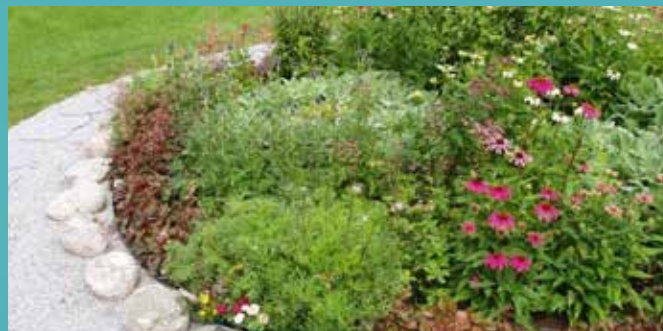
Askgravplatsen i Hjärtum är en inspiration och visar hur Västerlandas motsvarighet kan komma att te sig senare i år efter att perenner och sommarblommor planterats.