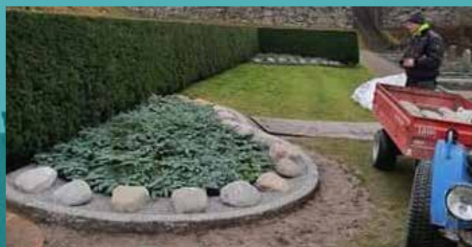
Den inledningsvis milda vintern har gjort att vi kunnat färdigställa 2 av 3 delar och dessa är nu täckta med granris.