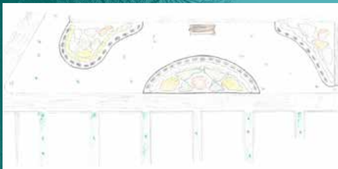
Skissen av askgravplatsen ritades redan 2016 och nu förverkligas denna på kyrkogården i Västerlanda.