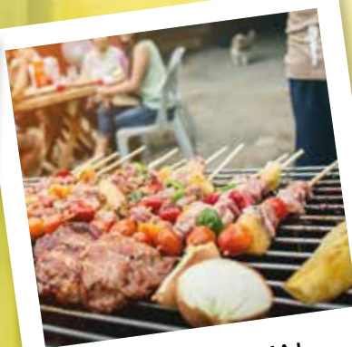
SÖNDAG XL 30 MAJ