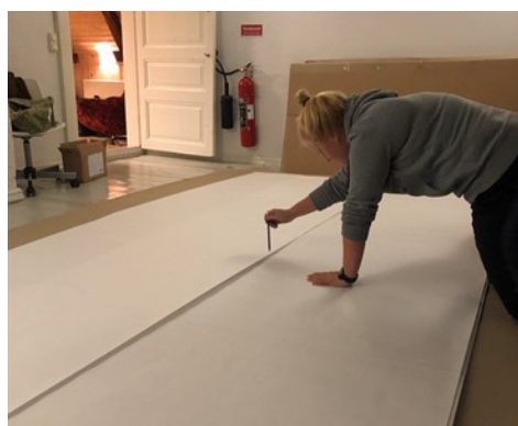
Kulisstillverkning till "Daniel i lejongropen"

Därför har vi öppnat upp inomhusverksamheten igen men i begränsat format. Max åtta personer får delta varje vecka vilket innebär att pastoratets ungdommar måste föränmäla sig innan varje torsdag.