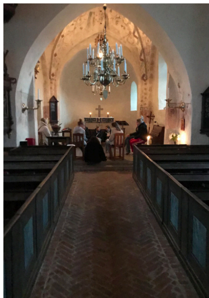
Effata-andakt i Balingsta kyrka, före pandemin