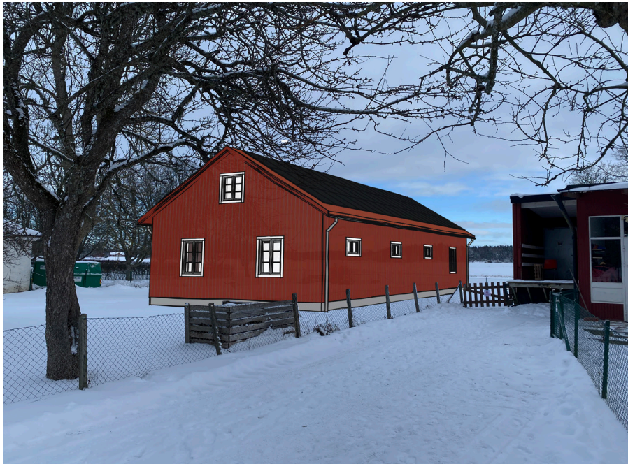
Fotomontage av garage och tvätthall i Balingsta