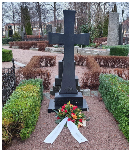
Waldemar Rudins grav på gamla kyrkogården i Uppsala. Kransen är från Uppsala-Näs församling

OBS. Programmet planeras att genomföras i Uppsala-Näs församlingshem och kyrka men kan komma att ske digitalt, beroende på pandemiläget.