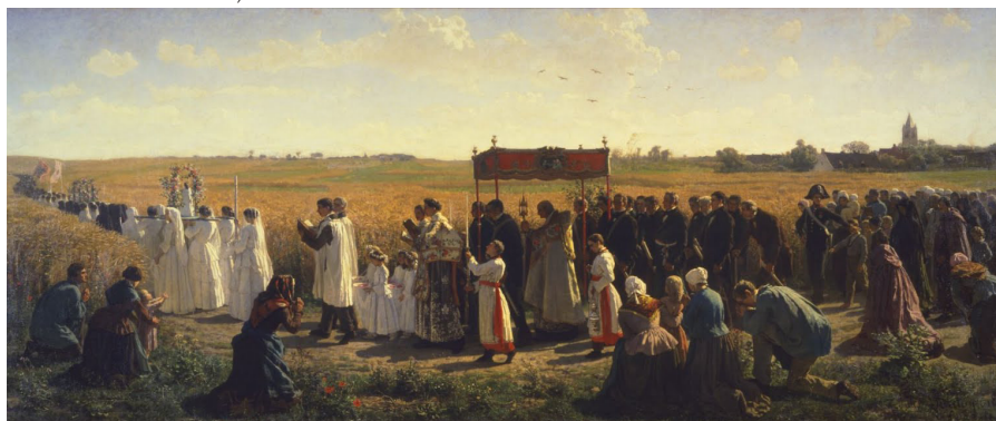
Gångedagar som det kan ha sett ut förr i någon av våra församlingar.

(Swahn, Jan-Öyvind Svenska traditioner 2007)