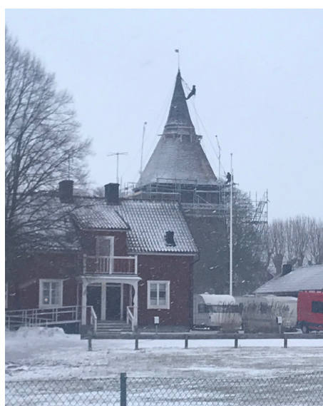
Byte av takspån i Dalby klockstapel 2019.

Våra kyrkors fönster är många och stora. De utsätts också för