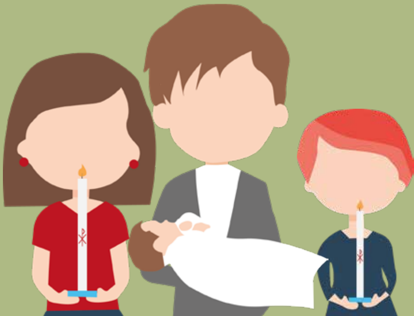
ILLUSTRATION: JULIA HÖGEFJORD ÅSLUND