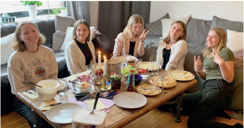
Några konfirmander på tjejdagen om konfaåret som varit: Det har varit lärorikt och en rolig aktivitet att ha efter skolan! Vi har kommit närmare varandra, och speciellt killarna i klassen. Den långa andakten med bönelappar, ljus och förbön var extra bra.

En vecka efter att de konfirmerats fick vi välkomna de nya konfirmanderna - drygt 30 ungdomar som vi fått lära känna mer och mer under året. Ni ska veta hur fina var och en av dem är! Det har varit en ära att få vara just deras ledare.