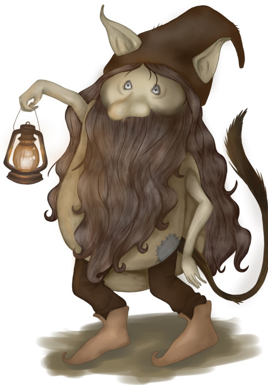
Illustration: Dorothea Malmros