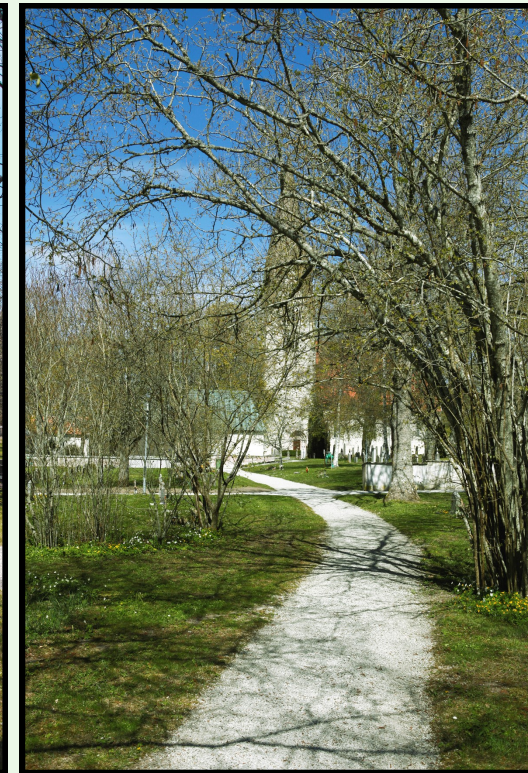
En ny obruten vy från ängskyrkogården mot kyrkan.