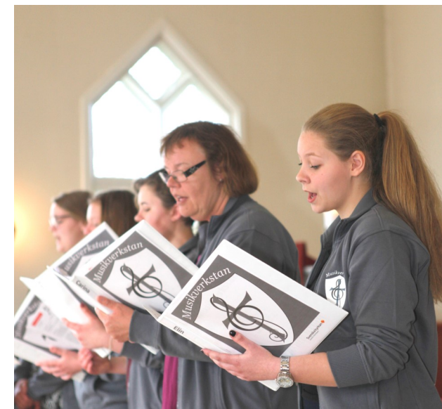
Text och foto: Sophie Malmros

Ella, vuxen medlem 25+: ”Kul att skapa nya sound på kyrkomusik tillsammans”