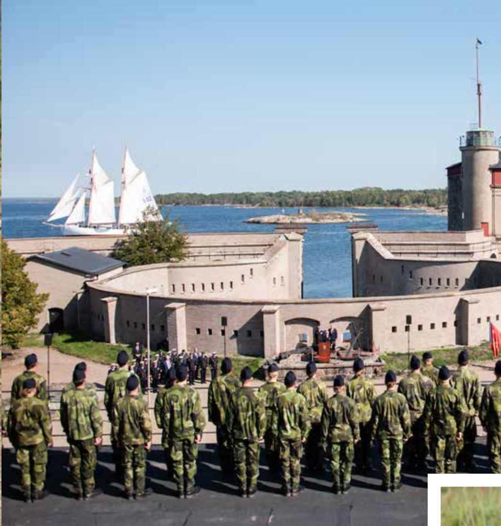
Återinvigning av Kungsholms fort.