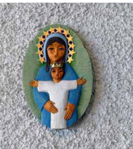
Eva Spångberg, 1988

Längs med altaret ser du ett vackert tyg, det kallas för altarbrun och det är också ett reliefbroderi precis som på predikstolen.