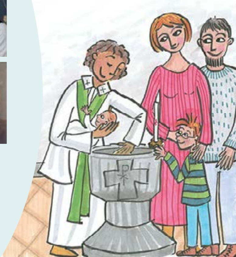
Illustration: Kajsa Nordenstorm /Ikon