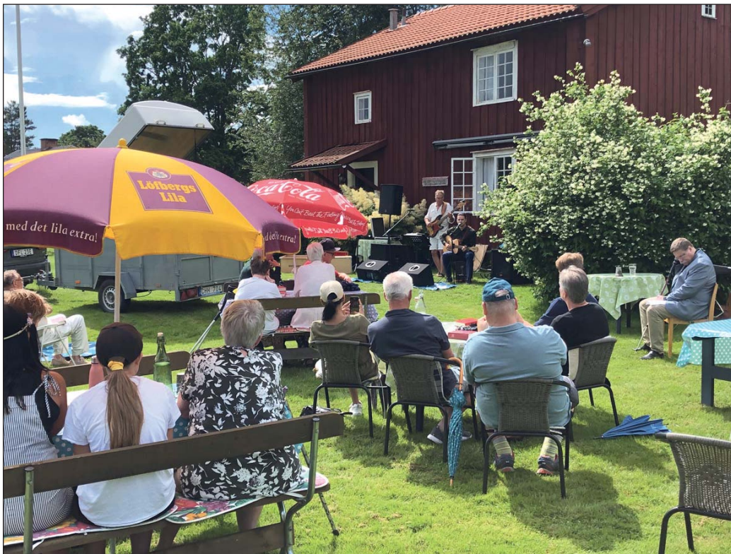
Firandet på midsommardagen samlade många åhörare som fick njuta av både fin musik och gott fika.