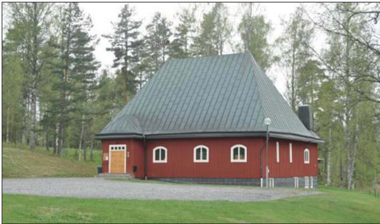
1971 stod den färdig, Lesjöfors kyrka, och under hösten stundar 50-årsjubileum.