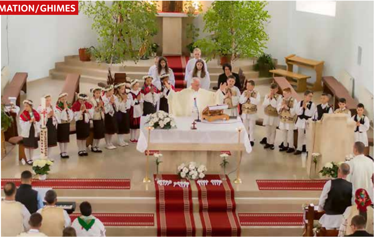
Första nattvarden fräs i Ghimes juni 2021