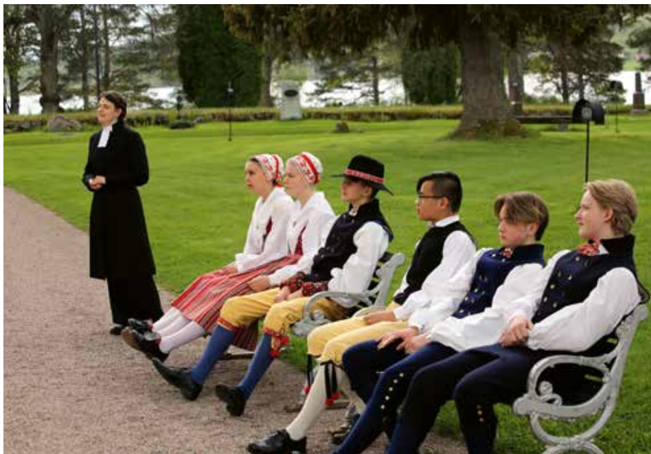
I väntan på konfirmation utanför Leksands kyrka, juni 2021

Precis som i Ghimes är konfirmationshögtiden i Leksand full av traditioner. Nästan alla konfirmander bär folkdräkt, vilket på ett fint sätt för traditionerna vidare till yngre generationer och knyter oss samman, inte bara i Siljansbygden utan också med vår vänort i Rumänien. ■