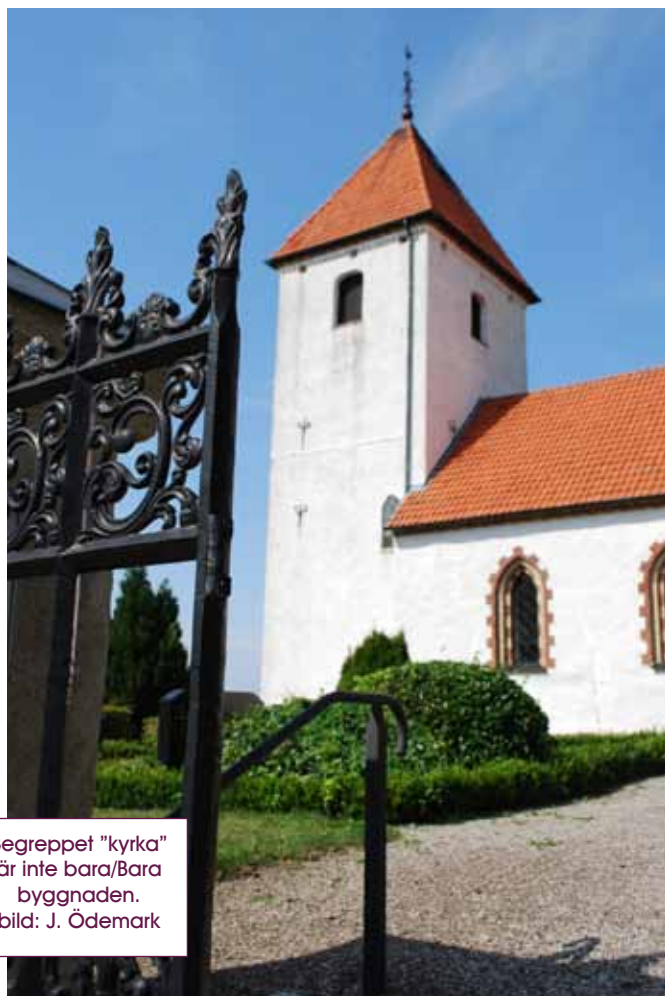
Begreppet "kyrka" är inte bara/Bara byggnaden.