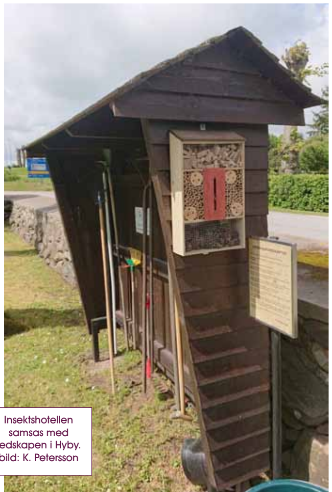
Insektshotellen samsas med redskapen i Hyby.