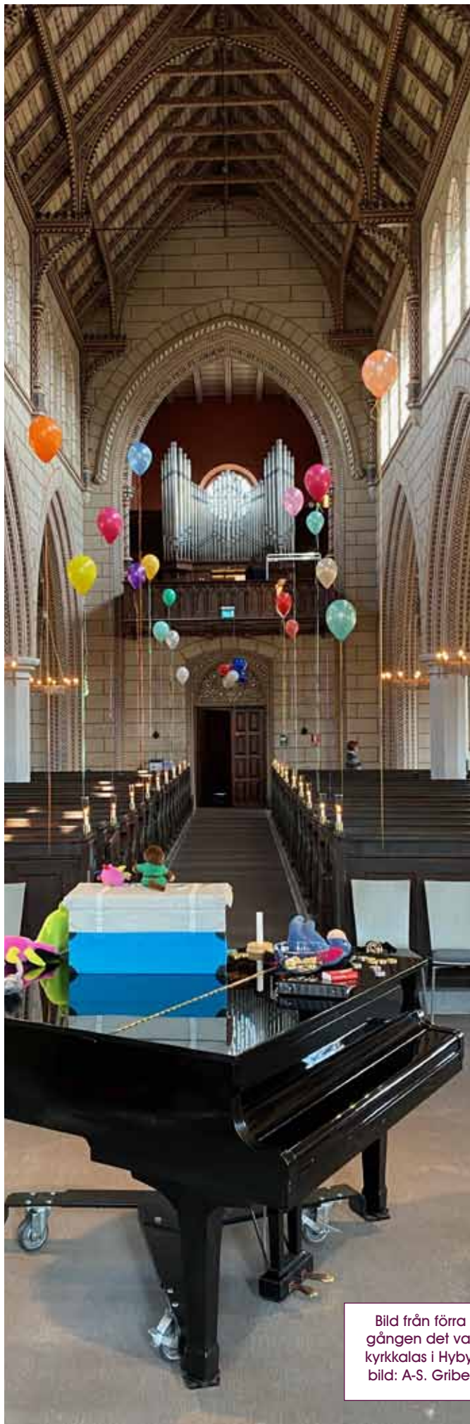
Bild från förra gången det var kyrkkalás i Hyby.