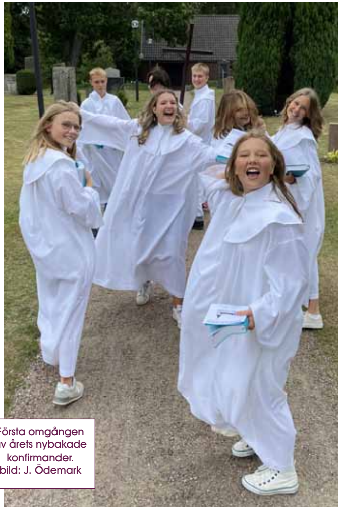
Första omgången av årets nybakade konfirmander.