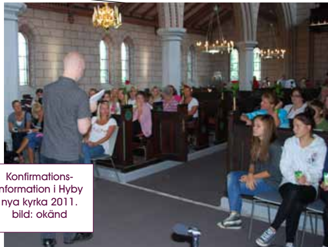
Konfirmations- information i Hyby nya kyrka 2011.