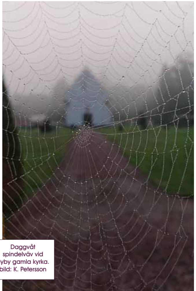
Daggvåt spindelväv vid Hyby gamla kyrka.