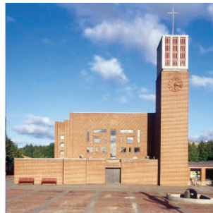
Sankt Hans kyrka Fäladstorget 32 226 47 Lund