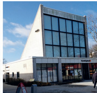
Samarbetskyrkan Sankt Knut Samarbetskyrka med EFS Linero Torg 12 224 76 Lund