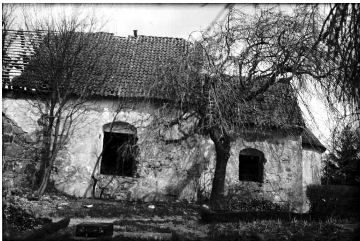
Fotografiet visar den förfallna kyrkan innan återuppbyggnaden på 1930-talet. Foto: Sven Brandel, 1922. Bilderna är hämtade från Riksantikvarieämbetets bilddatabas Kulturmiljöbild.