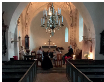
Effata-andakt i Balingsta kyrka, före pandemin