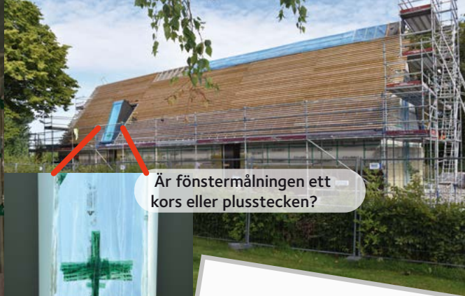
Är fönstermålningen ett kors eller plusstecken?