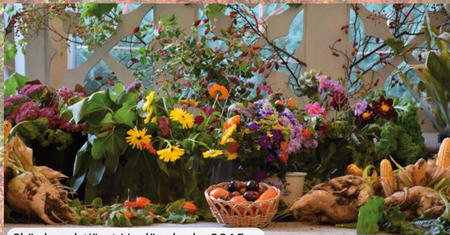
Skördegudstjänst i Igelösa kyrka 2015

Information om Allhelgonahelgen kommer på Torns hemsida, Kyrkguiden och anslagstavlor