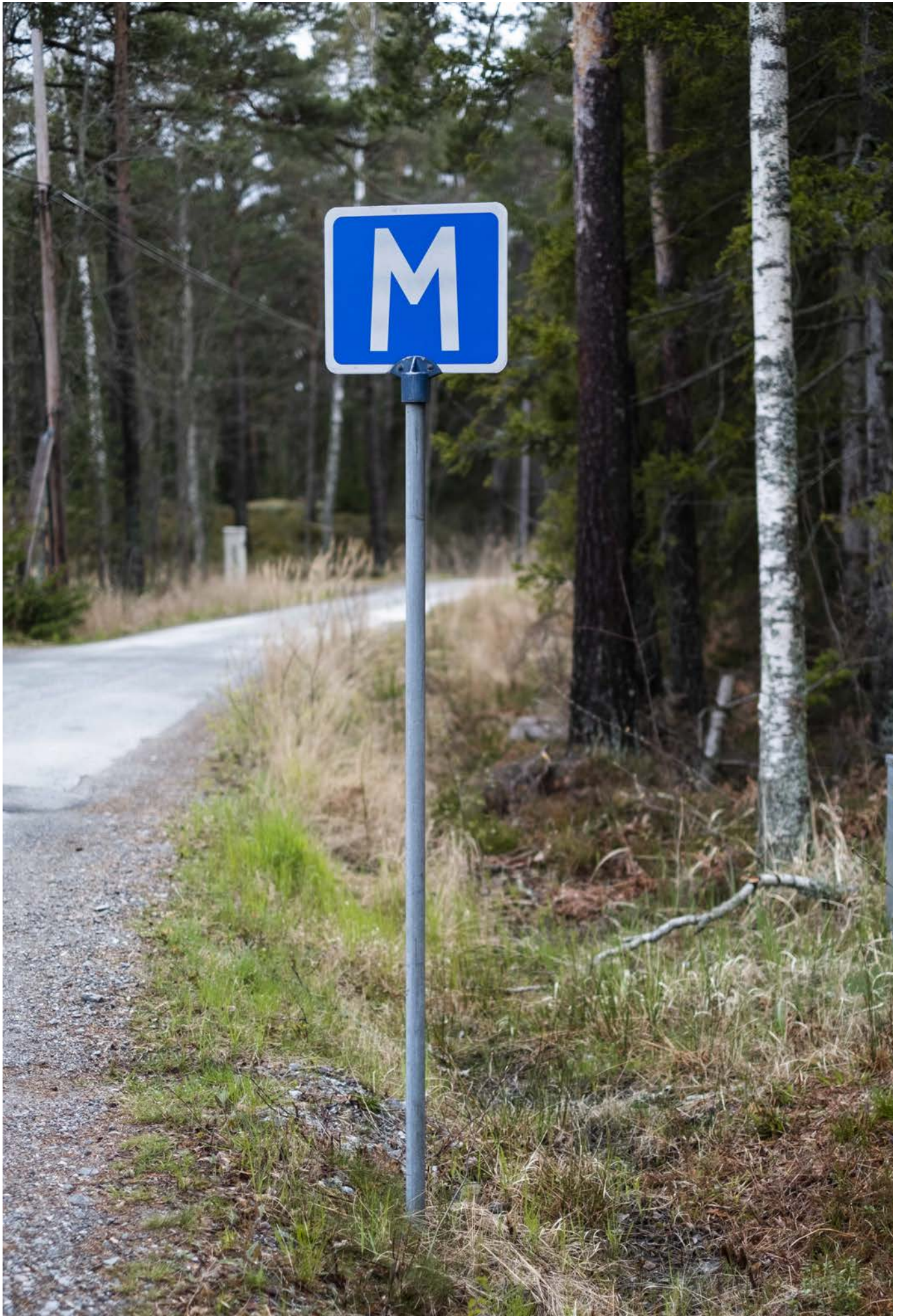
2 Alltid på väg - församlingsinstruktion för Orusts pastorat Antagen 2021-06-26