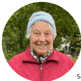
Gulli - deltagare "Gå med Gud"

Jag är tacksam för att jag har hälsan, att jag