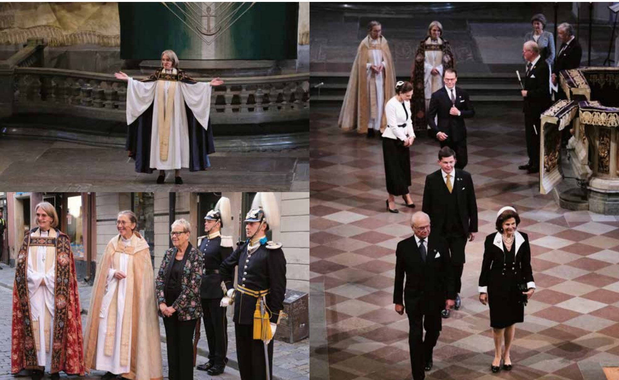
I samband med Riksmötets öppnande har Storkyrkan en traditionsenlig gudstjänst då riksdag, regering och kungahus bjuds in.

man automatiskt domkyrkoförsamlingen. Det är personer som är hemlösa eller bor på demensboende eller på en båt vid stadens kajer. De utgör 10 procent av medlemmarna och gör oss till en församling där välstånd och utsatthet finns sida vid sida.