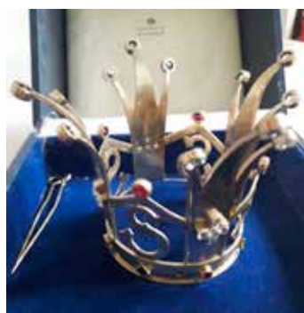
Brudkronan i Sillerud.