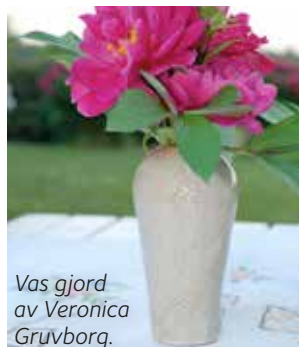
Vas gjord av Veronica Gruvborg.