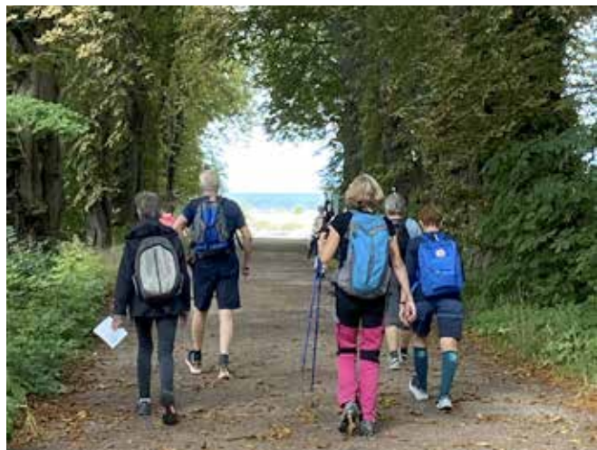
På väg från Borghamn.

På sista dagens vandring från Nässja kyrka till Vadstena kunde vi tidigt se tornen på Klosterkyrkan och slottet, men ännu hade vi långt kvar i gassande sol. På vespermässan i Klosterkyrkan blev vi välkomnade som pilgrimer och dagen