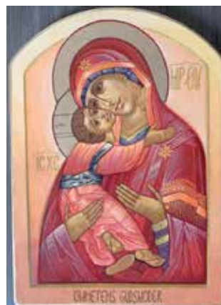
Maria Ömhetens Gudsmoder uppmålad på en stor tavla i Silbodals kyrka. Av ikonmålaren Kjellaug Nordstjör.

Konstformen har sin grund i den ortodoxa kyrkans centrum i Bysans. De äldst bevarade ikonerna är daterade till 500-talet. Ikonen är en symbol som vördas och äras. En mötesplats mellan himmel och jord. Ikonen står för det kristna hoppet och ska för den troende släppa in ljuset från evigheten.