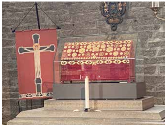
Målet för pilgrimers vandring - Heliga Birgittas relikvialskrin i Klosterkyrkan.

efter fick vi ett certifikat som bevis för vår vandring på Klosterleden.