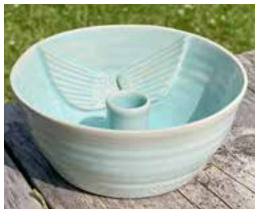
Skål gjord av Nilla Axelsson.