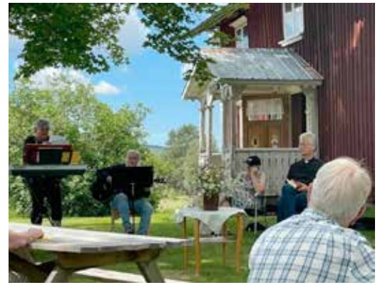
Friluftsgudstjänst på midsommardagen vid Östervallskogs hembygdsgård.