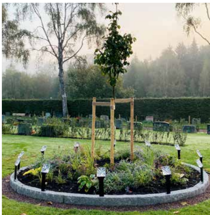
En av de tre rundlarna som utgör askgravplatsen.