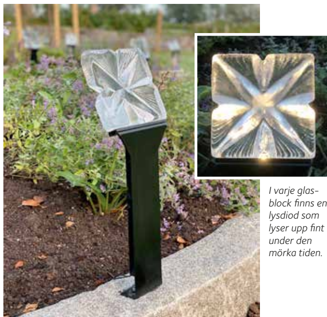
I varje glasblock finns en lysdiod som lyser upp fint under den mörka tiden.