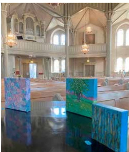
Konstutställning "Tro, hopp och kärlek".