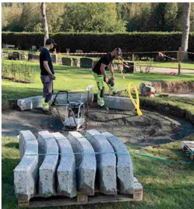
Företaget Sten och Väg AB arbetar med askgravplatsen tillsammans med kyrkvaktmästarna.