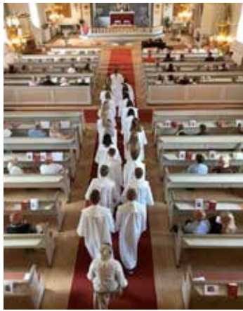
Konfirmationsmessa i Silbodals kyrka 2021.