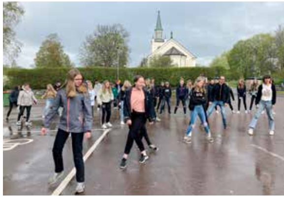
Vi fick en härlig kreativ dag i maj med våra konfirmander i pastoratet. De jobbade med teater, dans, sång och skapade egen musik.