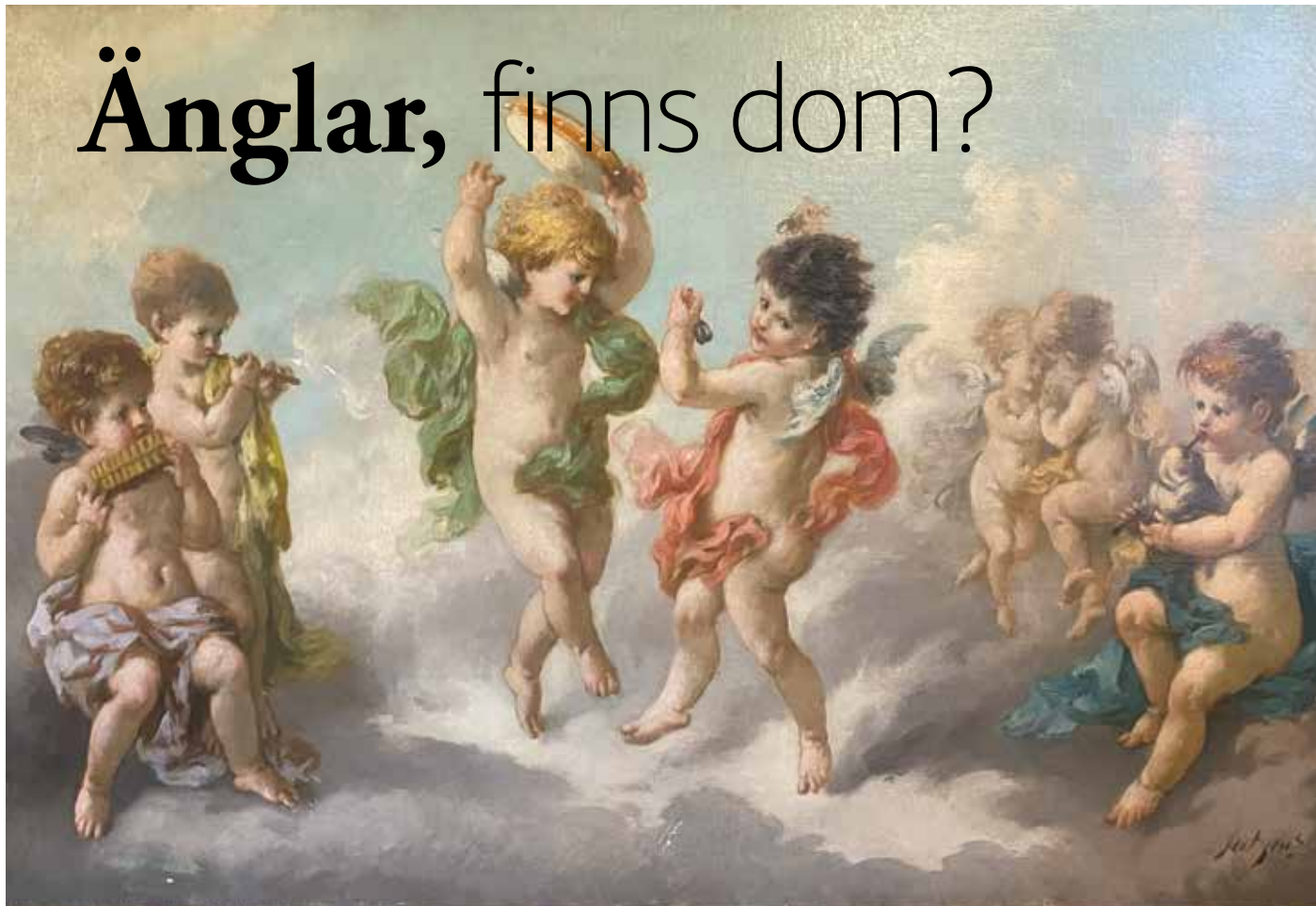
Vi är omgivna av änglar. Denna målning med spelande änglar finns i Ingarö kyrka.

STÄLLER MAN DEN FRÅGAN till någon som var med innan färgteven slog igenom, tror jag att många, istället för att ta den på allvar, först skulle referera till en filmsuccé från 1961 med samma namn. Den där Christina Schollin, Jarl Kulle och Edvin Adolphson hade de bärande rollerna. Eller så kunde man få ett Hasse & Tage-svar: Änglar finns, men dom är få det är sällan de syns, men då o då kan dom komma igen, jag tror dom bor i Vilhelmina. En yngre person kanske skulle ta gruppen Kampferdrops ord istället: Jag trodde änglarna fanns bara, bara i himmelen... En hit från 2017.