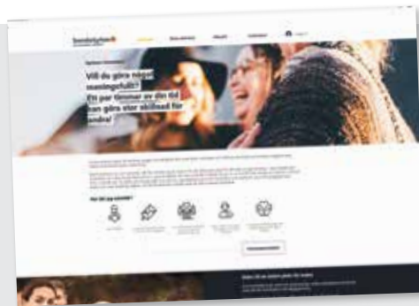
Hemsidan för volontärerna i Gustavsberg-Ingårö församling.

EN LITEN INSATS kan betyda mycket. Ett volontäruppdrag är inte det andra likt. Det kan vara allt ifrån att servera soppa