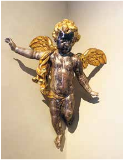
I Ingarö kyrka hittar man även ett par skulpturer föreställande änglar. Denna har tidigare tillhört ett belgiskt kloster.

vore det bäst om han fick en kvarnsten hängd om halsen och sänktes i havets djup.