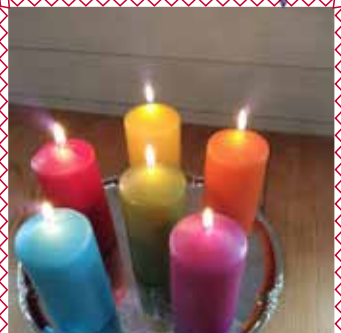
Målrummet används flitigt på After- school