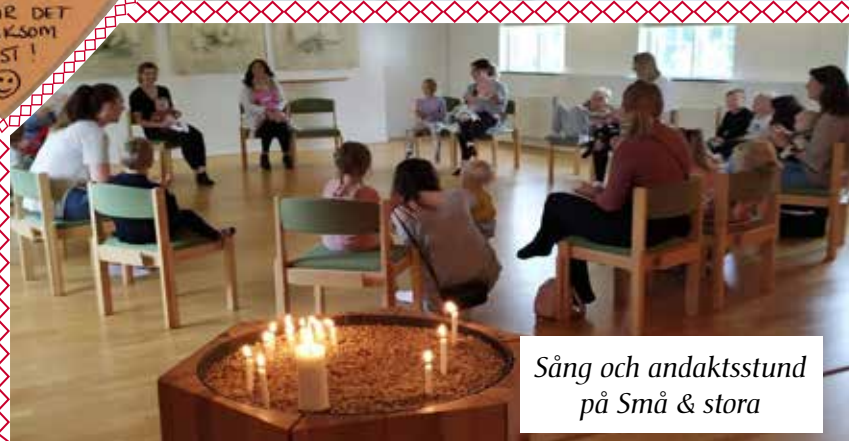
Sång och andaktsstund på Små & stora