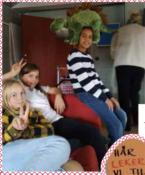
After-school. Tillsammans är ju bäst!