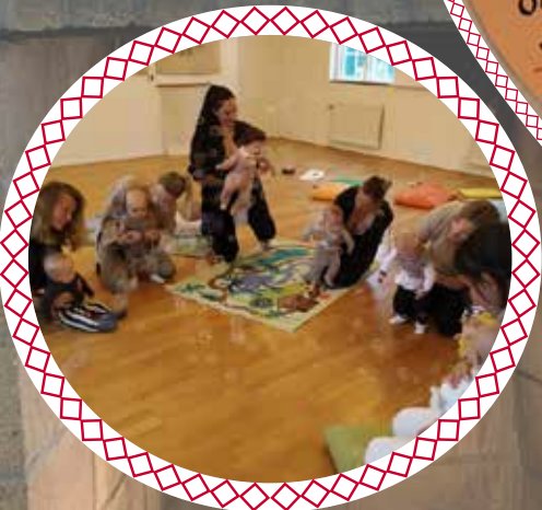
Härlig stund med de minsta på Babyrytmiken!

HÄR LEKER VI TILLSAMMANS OCH SÅ STÄDAR VI TILLSAMMANS! DÅ BLIR DET JU LIKSOM BÄST! 😊