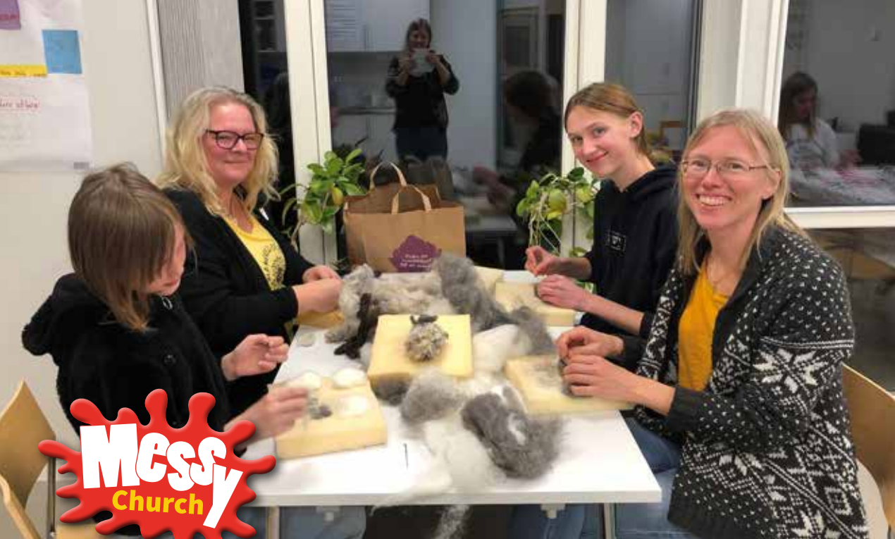
Kreativitet och härlig gemenskap är en del av Messy Church