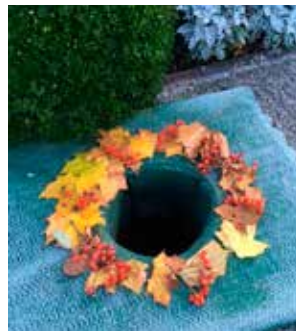
Förberedd urngrav