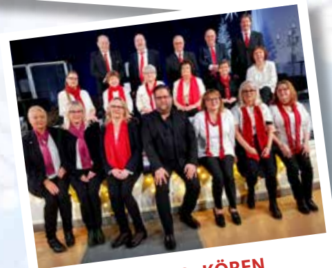
DA CAPO-KÖREN 18 dec Fuxerna kyrka