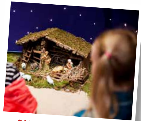
SAMLING VID KRUBBAN Julafton kl 11 Fuxerna kyrka