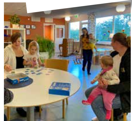
VUXEN-BARNGRUPP 0-6 år Måndagar och tisdagar