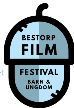
Illustration: Emanuel Eriksson

Mer info kommer på www.bestorpfilmfestival.se