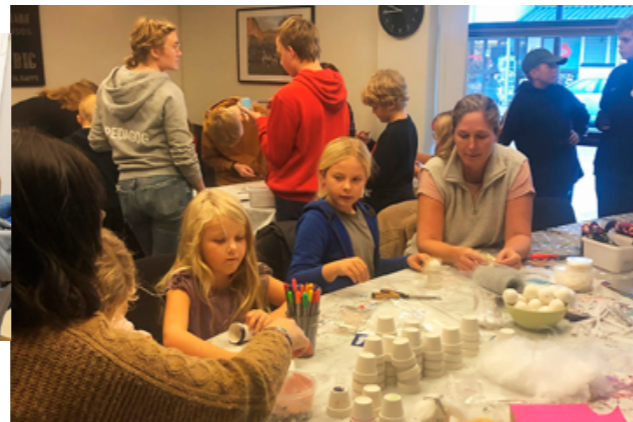
Under höstlovet var det återigen dags för höstlovskul där Crossroad fylldes av pysselsugna barn och unga.

Konfirmanderna fick under ett av passen pimpa sina biblar och göra dem mer personliga.