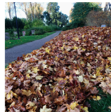
Inför Alla Helgonhelgen hade vaktmästarna mycket arbete med lövsamling m. m. på våra kyrkogårdar.