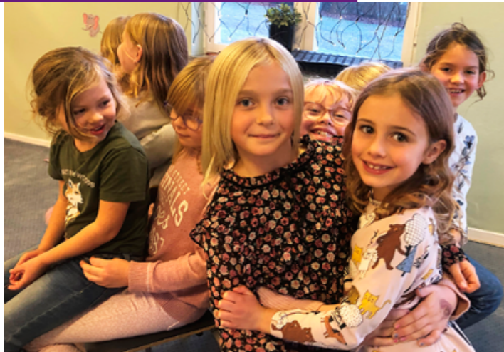
Att leka tycker Kyrkråttorna om, här leks det hela havet stormar med en twist.