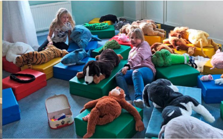
Vårt lekrum är den populäraste platsen om man frågar Kyrkråttorna.