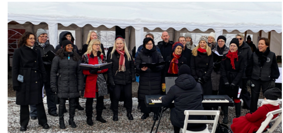
Nossan Gospel sjunger på Kälströms julmarknad under första advent.