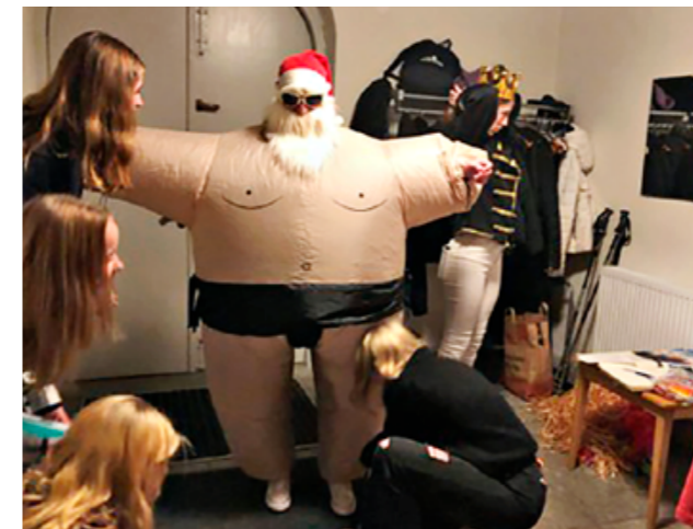
Vi firar första advent i Nossebro kyrka och på besök kommer en skum tomte.