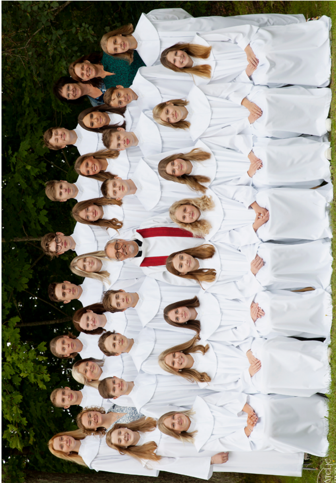
Konfirmandgruppen 2020–2021 vid konfirmationer i Främmostad och Essunga den 28–29 augusti.