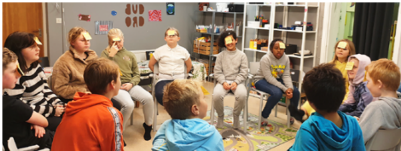
Under hösten har Guds Aktörer pratat, skapat och lekt en hel del. Här försöker de lista ut vem de har på lappen i pannan.