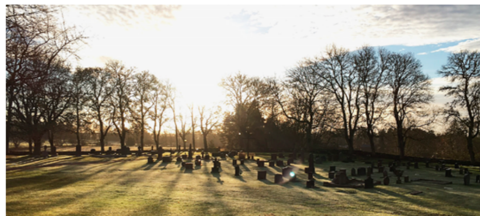
En höstdag på Lekåsa kyrkogård.

Du får inte bara rabatt, utan du är även med i den årliga medlemskortsdragningen, som sker i slutet av året! Där vinnarna kan vinna fina priser!