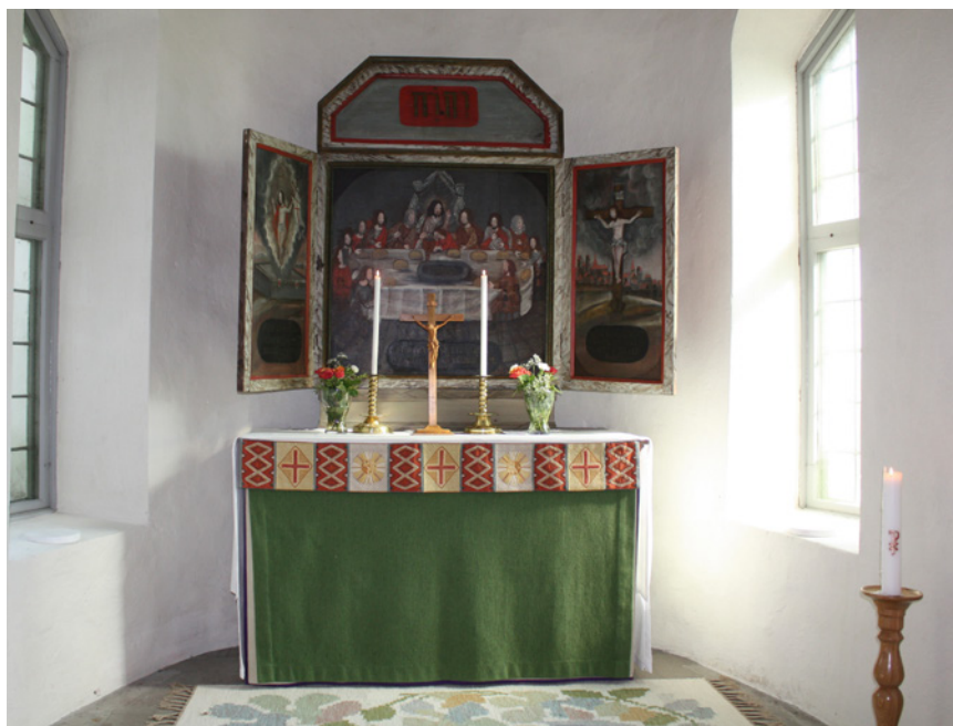
Altarskåpet är ursprungligen medeltida, men dagens utseende tillkom vid en ommålning under tidigt 1700-tal.

Larsson i Broby en ny altartavla med Nattvardens instiftande som motiv. Det saknas dock uppgifter om konstnär. I samband med renoveringen 1935 tog man ner tavlan och ställde tillbaka det medeltida altarskåpet. Numera har altartavlan förkommit och endast ramen finns kvar.