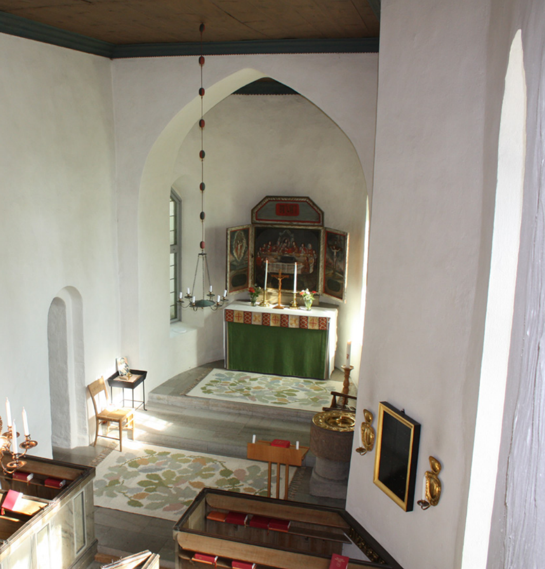
Triumfbågen har ett mycket ovanligt läge mellan koret och absiden. Det är oklart om det är ett medeltida läge, eller från ombyggnaden i början av 1800-talet.

skråkanten kan man även se inne i vapenhuset, på långhusets västgavel. Det visar att vapenhuset är senare tillkommet, men att långhusets västgavel hör till den ursprungliga kyrkobyggnaden. Samtliga takfall och takryttaren med sin spira är täckta med tjärade stavspån. De