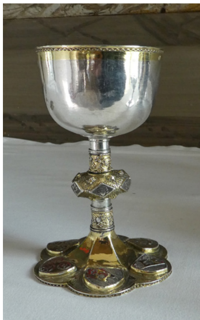
Nattvardskalken har en medeltida fot. Cuppan förstörades 1699.