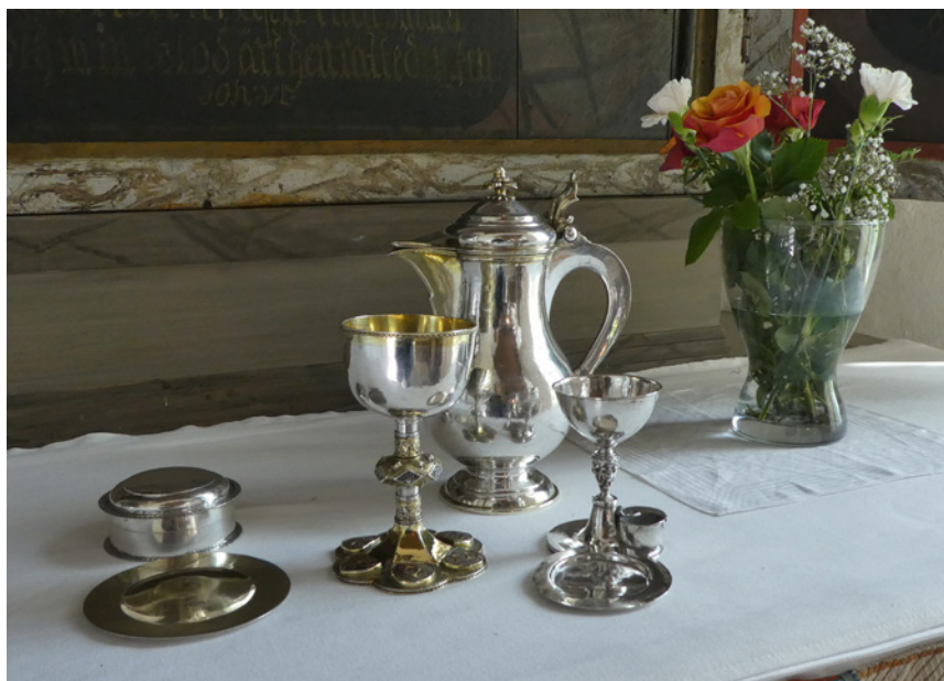
Nattvardsservisen. Till denna hör även ett sockenbudstyget med en liten behållare för oblater.

son för även fram möjligheten att nattvardskalken är ett krigsbyte som har donerats till Nässja. Det finns dock inga anteckningar om detta i den tidigaste bevarade inventarieförteckningen från 1691.