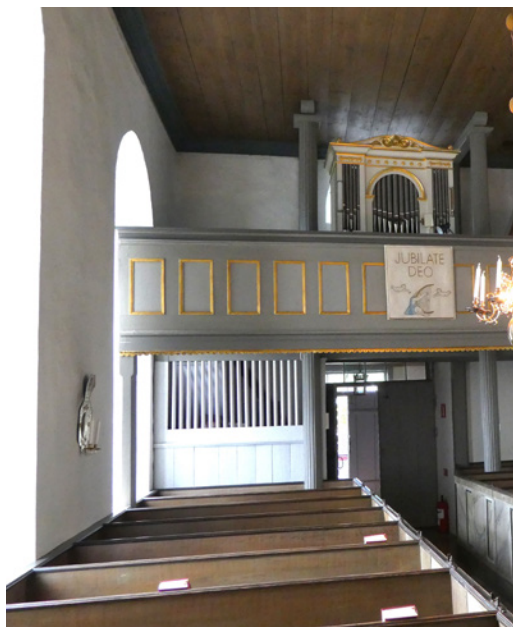
Interiören mot orgelläktaren. Från läktaren går trappan upp till vinden.

Kyrkorummet är litet och de båda bänkkvarteren tar upp en stor del av långhuset. Både långhus och kor har ett brunmålat bräddtak som avslutas nertill med en blåmålad profilerad list med uddkant. En kraftig spetsbågig triumfbåge delar av koret mot absiden. Mittemot dopplatsen vid den medeltida koringången i söder finns ingången till sakristian. Sakristiedörren är medeltida och mot koret består den av smala, horisontella hopnitade järnband, ringhandtag och dekorativt utformad låsskylt. Kyrkorummets utseende kommer till stor del från en renovering på 1930-talet. Även bänkinredningen fick sin utformning då, men har ett ålderdomligt utseende med bänkluckor. Bänkarna går ända ut till ytterväggarna, vilket också är ett äldre drag. I de flesta av dagens kyrkor har bänkarna kortats för att ge möjlighet till en gång utmed kyrkvägen. Orgelläktaren har ett enkelt utformat skrank med spegelindelning och färgsättning i grått och förgyllning. Läktarskranket avslutas nertill av en förgylld uddlist. Läktaren bärs upp av pelare och kolonner. Kyrkorummet i Nässja