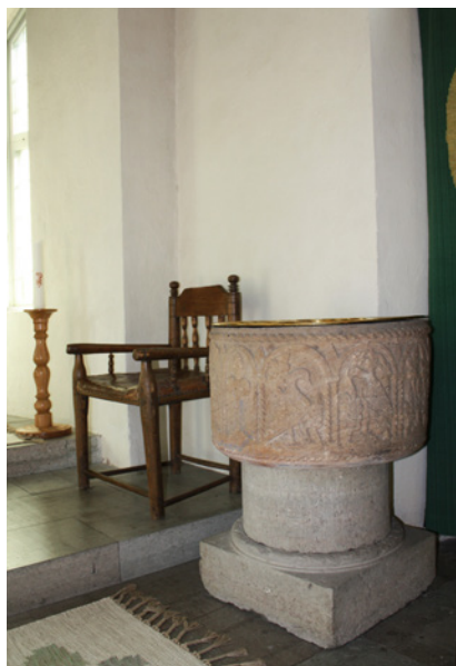
En dopplats har anordnats innanför koringången. Dopfunten är daterad till strax före mitten av 1200-talet.