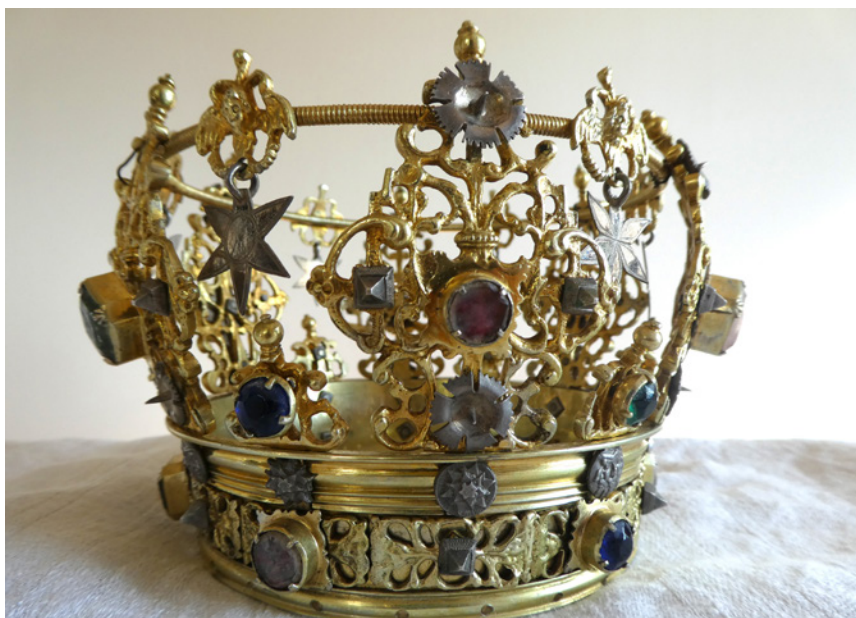
Brudkrona från 1754, tillverkad av Magnus Frölin, Vadstena.

målarguld till kedjans och knapparnas stoffering. Till kyrkan hör flera ljusstakar av barockmodell med spiralvridet skaft och fot med punsad och driven dekor i form av blommor och blad.