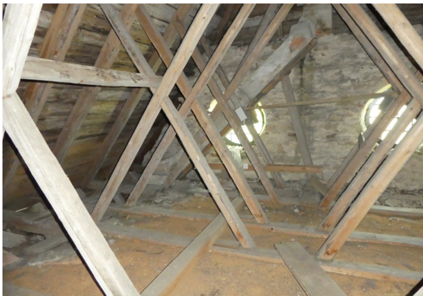
Takstolen mot öster, över det förhöjda koret. I bakgrunden syns murstocken till kaminen, som tidigare stod framför det norra bänkkvarteret.

förmögna utsocknes invånare. Vid samma sockenstämma gjorde man en projektbeskrivning över reparationen, men tyvärr ville man inte ta med den i protokollet om det skulle bli någon ändring framöver. Därför är det inte helt klart vad man verkligen gjorde, men rivning av valven och höjning av korväggarna nämndes i senare protokoll. Det tog några år innan man hjälpligt kunde enas om ombyggnaden men under tiden köpte man in material, som bräddor, plank, kalk och tegel. I räkenskaperna för maj 1819 finns utgifter för murare, snickare och takstolar. På hösten 1822 var om-