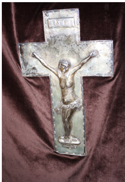
Silverkors på mässhaken från 1773.

Öfwerhetens anmaning” att upphöra med begravningar i kyrkan, samt kyrkogårdens utflyttande utur byn. ”Konungens Landsfaderliga Omsorg för undersåtarnes wäl erkändes underdånigast” och man beslutade att något lik inte skulle begravas i Nässja kyrka. Däremot framhöll man kyrkogårdens höga läge vid änden av byn och den friska luften från Vättern och beslutade att inte flytta kyrkogården.