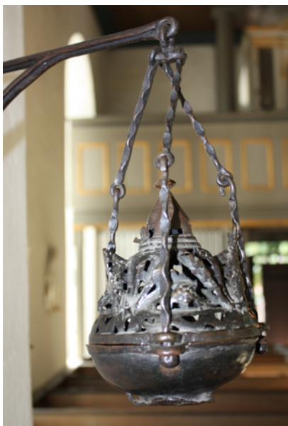
Det medeltida rökelsekaret hängs idag upp invid dopplatsen.

knuten till Vadstena kloster. Det kan vara en anledning till att två av kyrkans inventarier eventuellt ursprungligen har funnits i klosterkyrkan i Vadstena. Det gäller altarskåpet och nattvardskalken.