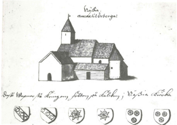
Teckning av Näsja kyrka, Elias Brenner 1670. Han har även ritat av vapensköldarna på nattvardskalkens fot.

Den tidigaste avbildningen av kyrkan är gjord av ritaren vid Antikvitetskollegium, Elias Brenner 1670, och den visar ett stort vapenhus framför den medeltida huvudingången i söder samt en låg träbod som går ända fram till absiden. På takets västra del finns en takryttare och sakristianskymtar i norr. Vindskivorna till kortaket, långhustaket och taket över vapenhuset är dekorativt avslutade. Takryttaren är troligen putsad och har små gluggar högt upp på sidorna.