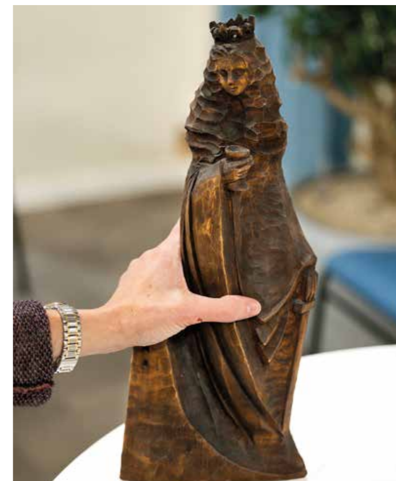
Sankta Barbara, skyddshelgon för bland annat tunnelarbetare.