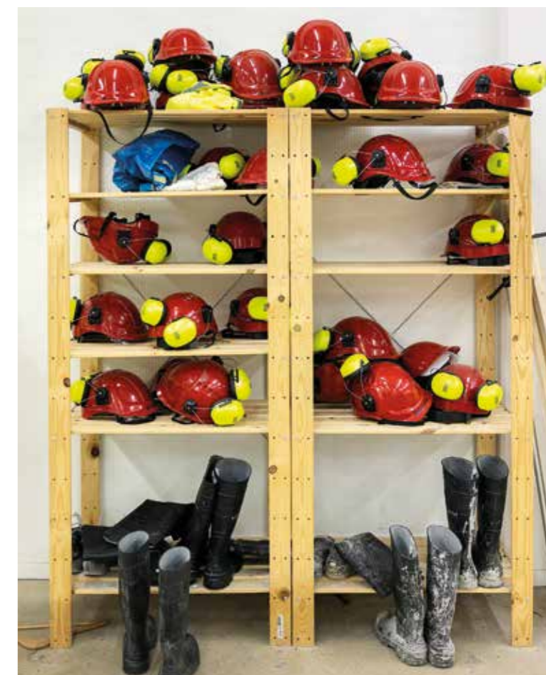
Obligatorisk och väl använd skyddsutrustning.