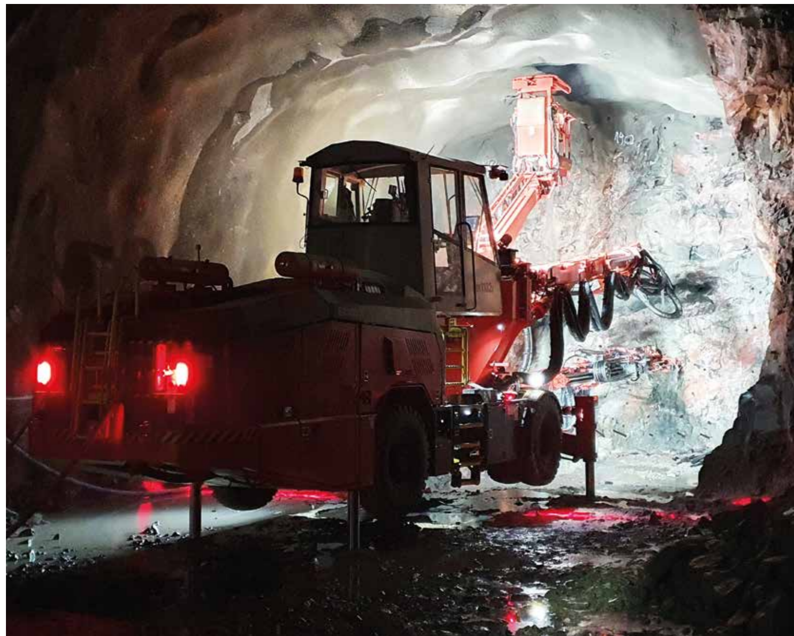
Massiva maskiner behövs för tunnelborringen.