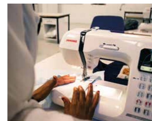
Arbete i syateljén.

Järfälla var en av de första kommunerna som använde den här metoden.