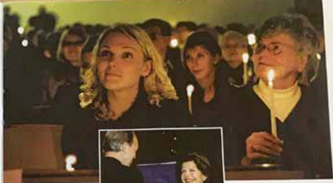
Hela kyrkan avslutar en studie för.