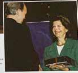
Drottning Silvia tar emot gåvan.

JESUS Så den andra parten: Vi har fått på den svenska bibelöversättningen. När Jesus följde honom på sin ämbets resa till oss. En bra församling. Gud. Vill du ansvaret på dig? Gud lär på att vi inte tror alla kyrkor ta hand om ett barn! Och detta barn Jesus är. Liknelse: Guds eget teckenspråk. Så här säger Gud till oss. En barn i vår famn. Utländsk. Berömd. Radd. Island. Som vil. Juden betyder att Gud är mycket nära. När vi ser Markusevangeliet berättas om barnet Jesus. ser vi hur Gud är. Jesus växer till och blir tyllig och tylligare. Guds tecken här kan oss. Markusevangeliet tecknar för oss. Den stora berättelsen om att Gud vill omfamnas hela sin skapelse och alla sina människor med kärlek. Närbart. Önsket. Rättvisa. Tröst. Kraft. Godhet. Det behövs många sidans omfamningar i vår värld idag. Vi är alla inbjudna. Kallade, uppmanade, att vara med! Att vara med i Döva kyrkan är att dela Jesusnöden. Att glädjas över vänner från vår lilla värld från Gud. Men också att dela ansvaret för att vår värld får en bättre plats att leva på. Att vara tecken på det Guds. Det Sanna. Det som kan på en ordlös och mörker.