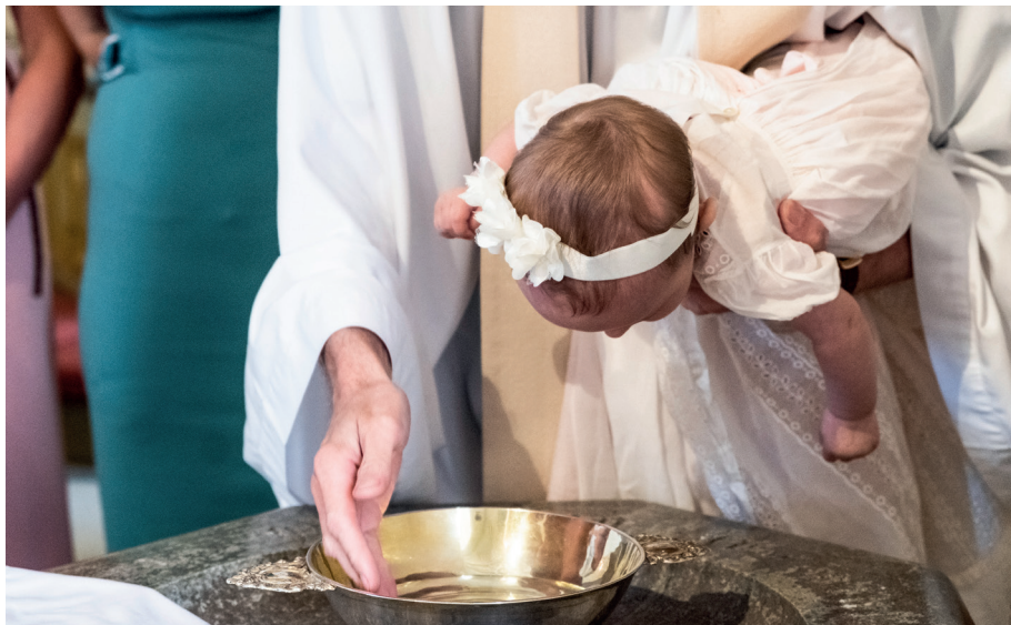
Dopet är en gåva och en kärleksförklaring.

■ Dopet i hemmet med det allvarligt sjuka barnet som var så infektiöskänsligt. Där bönen om Välsignelse blev så levande och påtaglig och fick dröja kvar som en omfamning i hemmet.