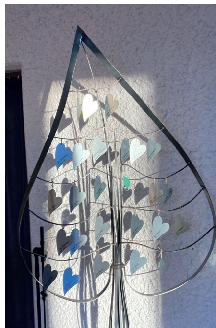
Dopträdet i Broselsgården i Byske.

I Kågedalens församling delas för närvarande en doppärla ut, i Jörn-Bolidens församling en ängel, i Sankt Olovs församling en droppe och i Skellefteå landsförsamling en droppe/fisk.