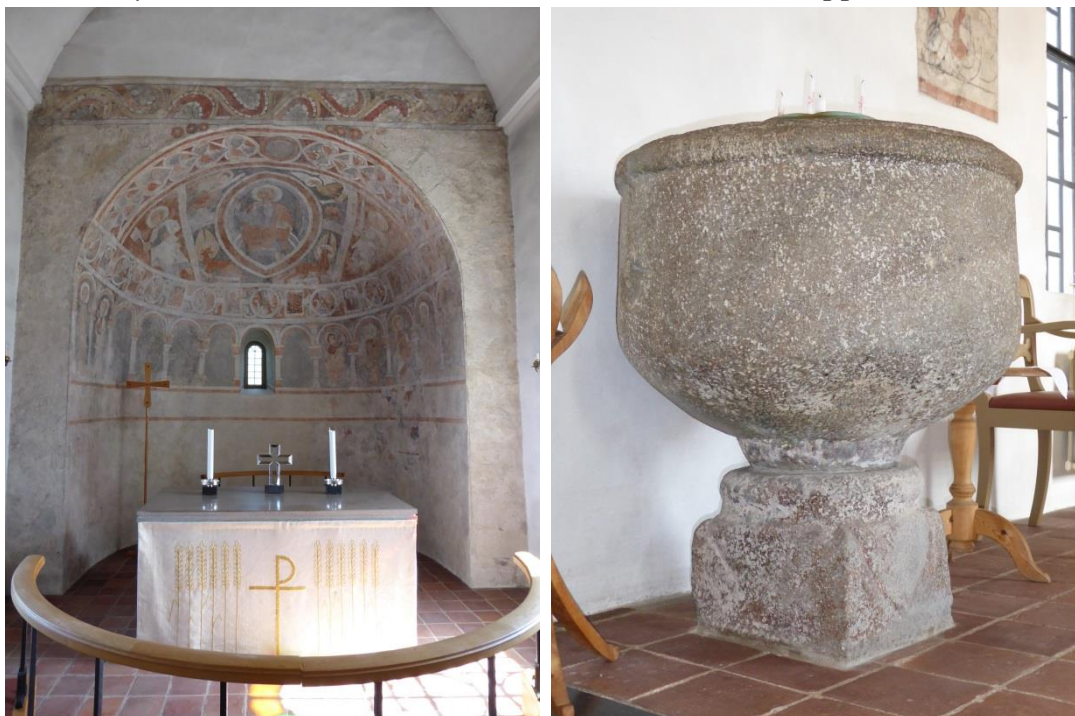
De medeltida målningarna är bäst bevarade i absidens hjälmvalv och på korets östra vägg. Tribunbågen har inget murat anfang. Dopfunten på bilden till höger hör till kyrkans äldsta föremål. Den tillverkades sannolikt av den så kallade Färlövsgruppen under 1200-talet.

sen är uppbyggd i tre horisontella skikt och står på ett senare, ombyggt altarbord. Uppsatsen är dekorationsmålade med marmorering i en grå grundkulör. Det nedre fältet har två infällda oljemålningar med bibliska motiv, åtskilda och inramade av lisener. I ytterkant markeras fältet av snidade trävoluter. Uppsatsens andra vå-