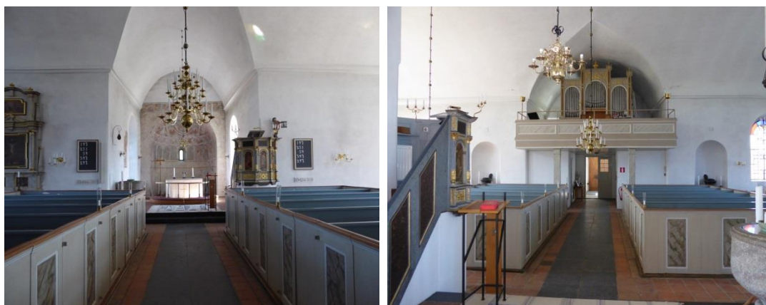
Kyrkorummet sett från väster mot koret respektive från koret åt väster. 1800-talets tillbyggda korsarmar har satt tydlig prägel på kyrkorummet. De böga tunnvalven tillkom vid den tiden. Koret och absiden är den del av kyrkan som tydligast bär spår av medeltid. Denna karaktär har lyfts fram och förstärkts under 1900-talet. Kyrkan har två slutna bevarade bänkkvarter, i övrigt består sittplatserna av lösa stolar. I rummets västra del finns orgelläktaren som tillkom under 1860-talet.

fönster över porten. I västväggen i vardera korsarm är en gjutjärnskamin placerad i en nisch.