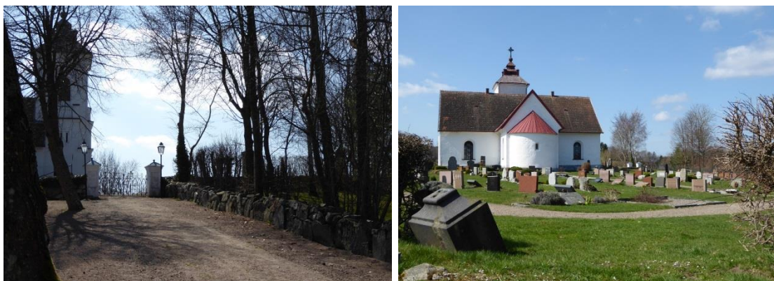
Brösarps kyrka ligger på en höjd. Från landsvägen leder en trädkantad grusväg fram till kyrkogårdens norra entré. Bilden till höger visar kyrkan och kyrkogården från den östra gränsen. Här syns den medeltida absiden och koret, korsarmarna och tornet som byggdes om och till under 1800-talet.

Byns framväxt i vägkorset mellan Kristianstad, Simrishamn och Tomelilla gjorde den tidigt till en knutpunkt som under 1600-talet försågs med både gästgiveri och skjutsstation. Vid mitten av 1800-talet fick Brösarp läkar- och poststation, skola, bibliotek och bank. Det lilla sockencentrat utvecklades till en centralort. När järnvägen anlades hamnade stationen och tillhörande ny bebyggelse ca 1.5 km norr om kyrkbyn vilket gjort att kyrkbyns lantliga karaktär med ålderdomligt gatunät bevarats. Den äldre bebyggelsen ligger tätt längs med landsvägen mot Simrishamn med kyrkan i den västra delen av den gamla bytomten. Strax norr om kyrkan ligger den f.d. sockenstugan, skolan och lärarbostaden. Än idag har Brösarp karaktär av centralort i området.