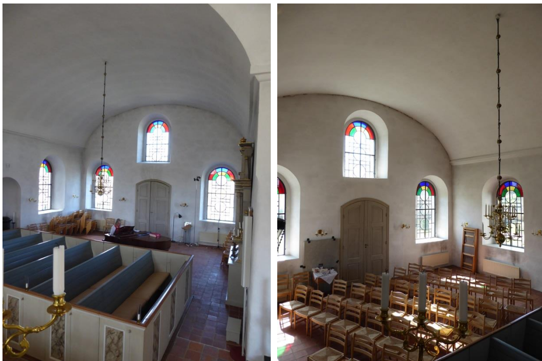
Utblick från orgelläktaren över kyrkans norra respektive södra korsarm.

golvnivå i östra muren leder till långhusvinden. Taklaget består till största delen av furu och härrör sannolikt från 1800-talets stora ombyggnader. Som en del i en