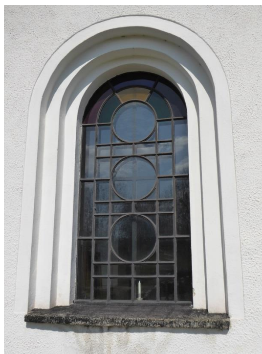
Kyrkans sockel är målad i kimröksgrå kulör. På kor och absid är sockeln endast målad, på övriga kyrkan är sockeln murad och skjuter ut utanför fasaden. Kyrkans fönster av gjutjärn har samtliga rundbågade och slätputsade omfattningar i tre språng. Slätputsen kontrasterar mot den övriga fasadens spritputs. De övre glasen i fönstren är färgade vilket ger ett intressant ljusspel i kyrkorummets interiör.