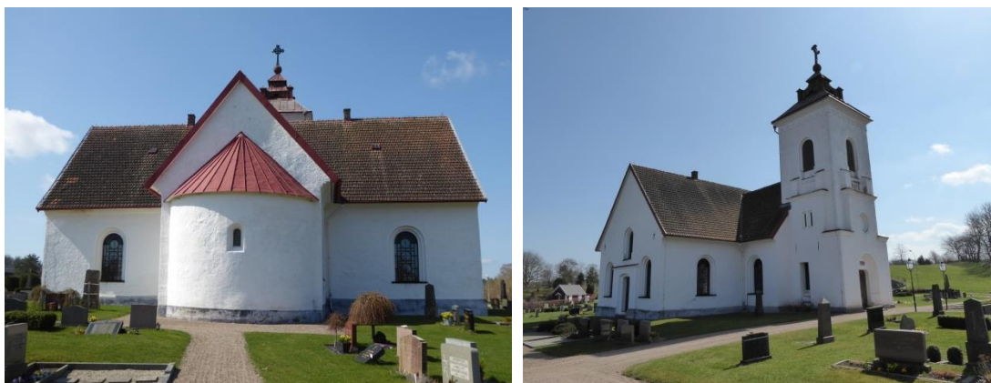
Brösarps kyrka från öster, den delvis ålderdomliga putsstrukturen syns tydligt på bland annat korets östra vägg. Det lilla rundbågade fönstret i absiden ersatte på 1970-talet en dörr på samma plats. Fönstret var en del i en renovering som lyfte fram kyrkans medeltida spår i kor och absid. Huruvida ett fönster likt detta ursprungligen suttit i absiden är okänt.

År 1331 blev Brösarps kyrka kanonikat vid domkyrkan. Ett kanonikat var ett prebende: ett godsinnehav i form av gårdar och/eller andra ägor vars inkomst användes till att betala lönen för en befattning inom till exempel kyrkan. I detta fall en tjänsteman vid domkyrkan. Detta förhållande varade fram till reformationen. Fyra medeltida träskulpturer som tillhört Brösarps kyrka finns idag på Lunds Universitets Historiska Museum. Dessa antas ha kommit till Brösarps kyrka genom ärkebiskopen, tack vare kanonikatet. Kyrkan dekorerades under slutet av 1200-talet med kalkmålningar, av vilka det idag finns rester i koret och absiden. Målningarna har bedömts vara besläktade med de i Åhus kyrka, vilken också tillhörde ärkebiskopen. Under 1400-talet valvslogs kyrkans långhus och kor. Under 1500-talet fick de äldre målningarna ge plats åt en ny generation kalkmålningar. Under senmedeltiden tillkom också ett vapenhus.