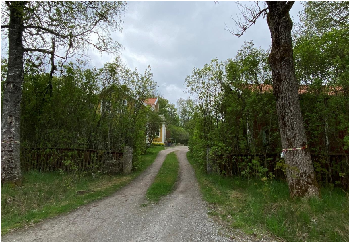
Före detta prästgård.