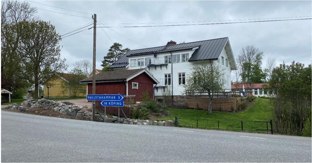
Före detta skola.