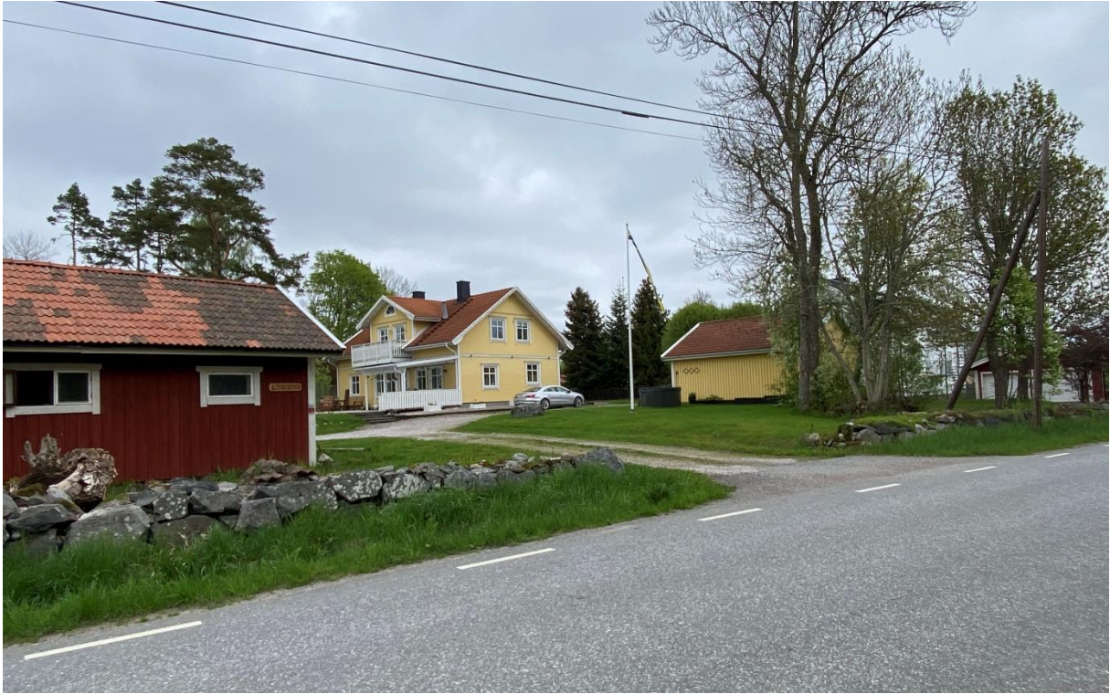
Nybyggt hus på platsen för klockargården.