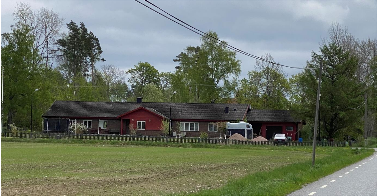
Före detta Godtemplarlokal.