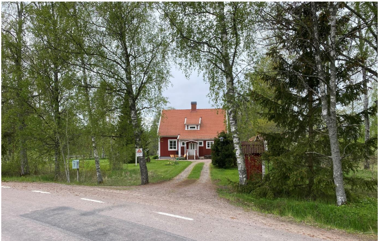
Före detta arrendebostad.