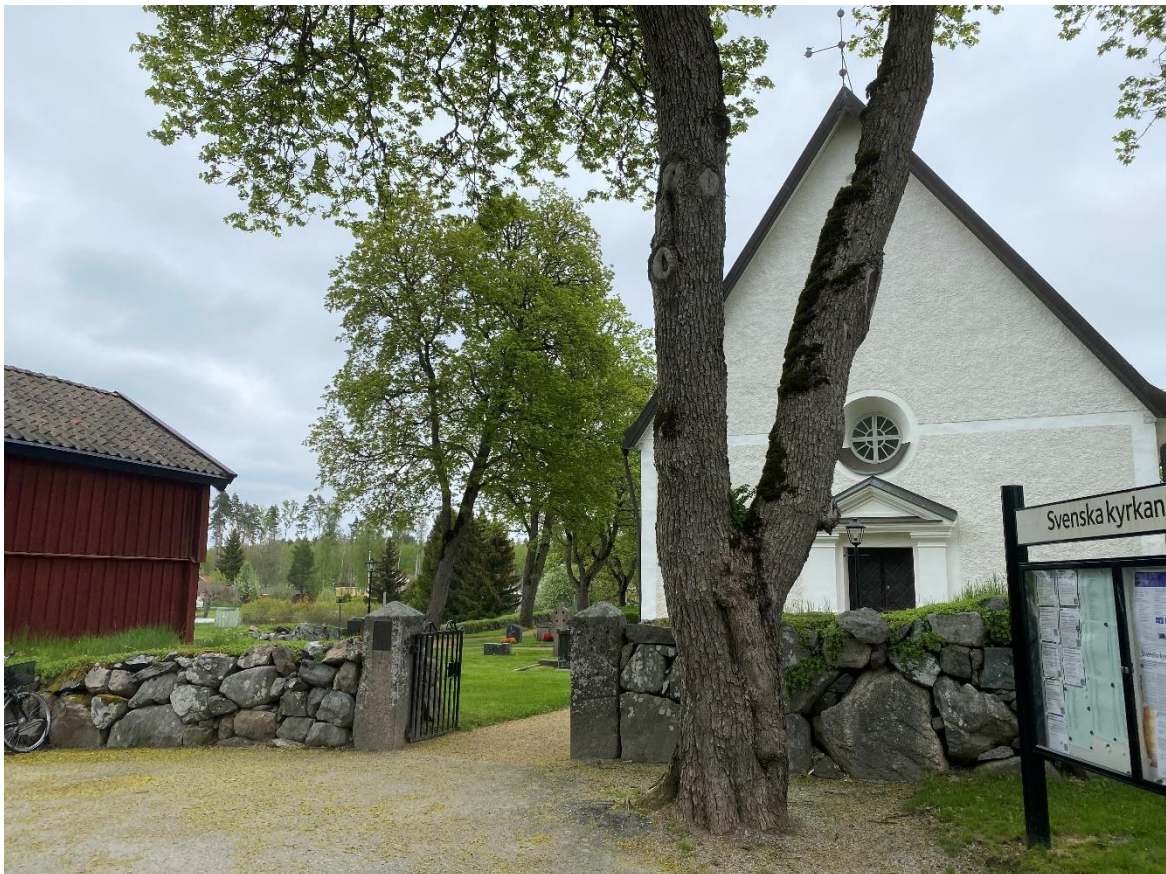
Bergs kyrka med tionebod till vänster.