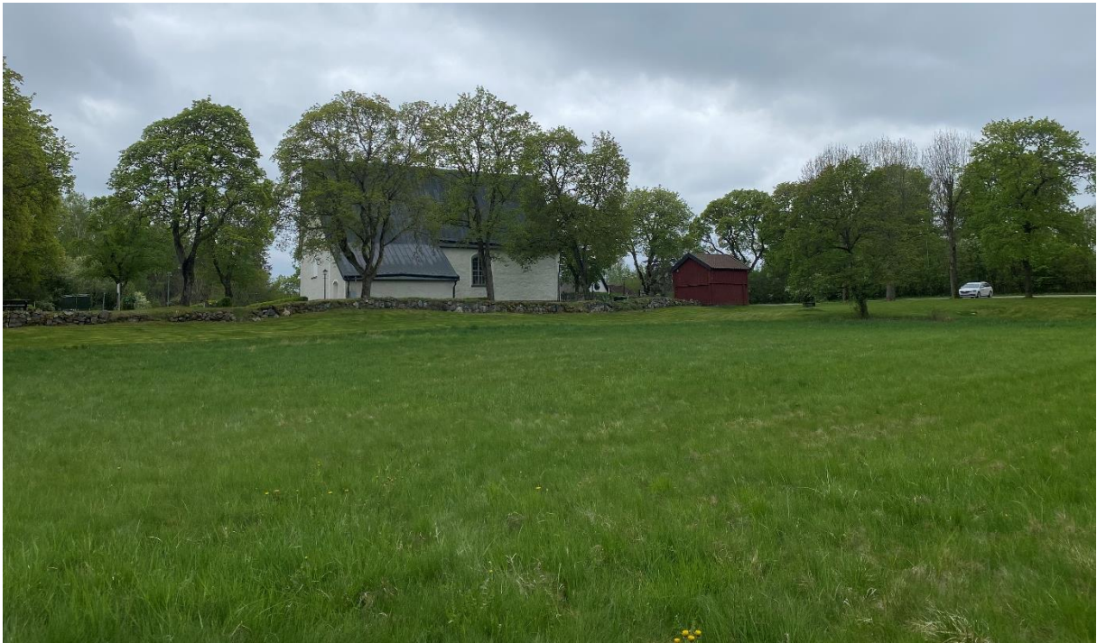
Öppen grön yta norr om kyrkan.