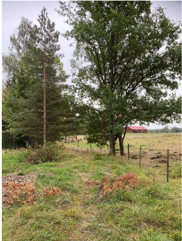
Klockarsten och äldre kyrkstig.