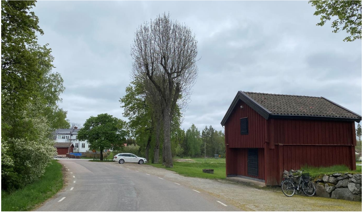
Väg från söder förbi kyrka och tiondebod. Före detta skolbyggnad i fonden.