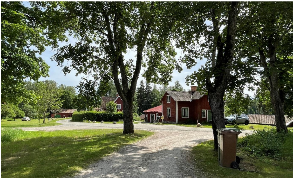
Vy från kyrkan ner mot skolbyggnader mm.