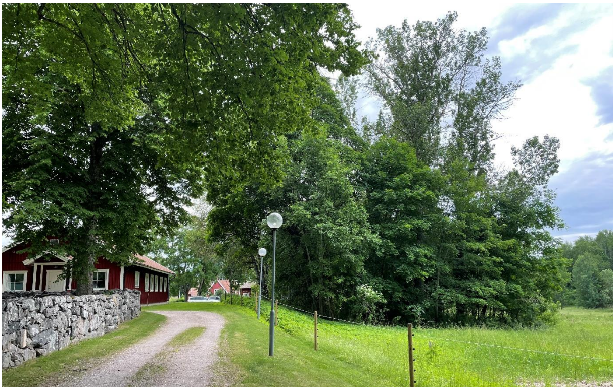
Församlingshemmet med dungen som tidigare utgjorde trädgård/park till prästgården.