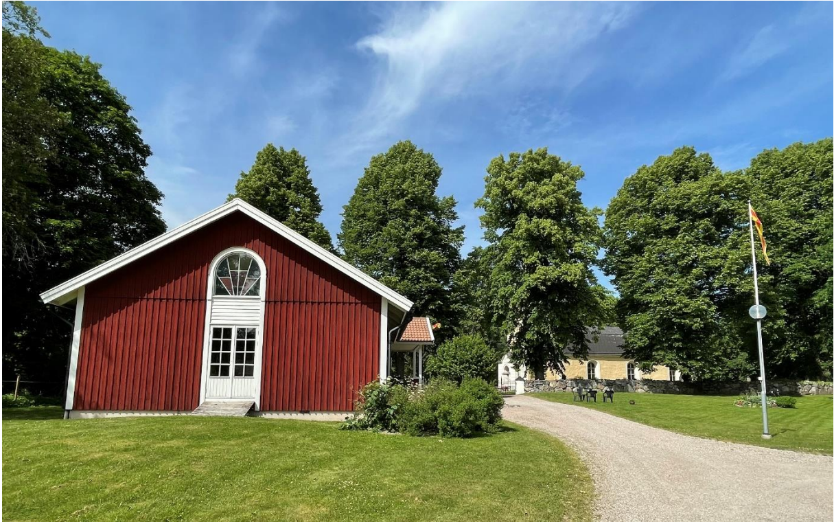
Församlingshem där prästgården låg innan.