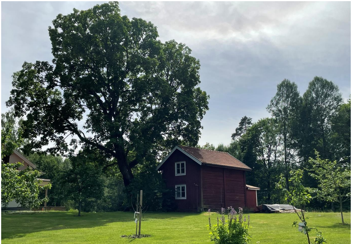
Sockenmagasin på komminister/klockargården.