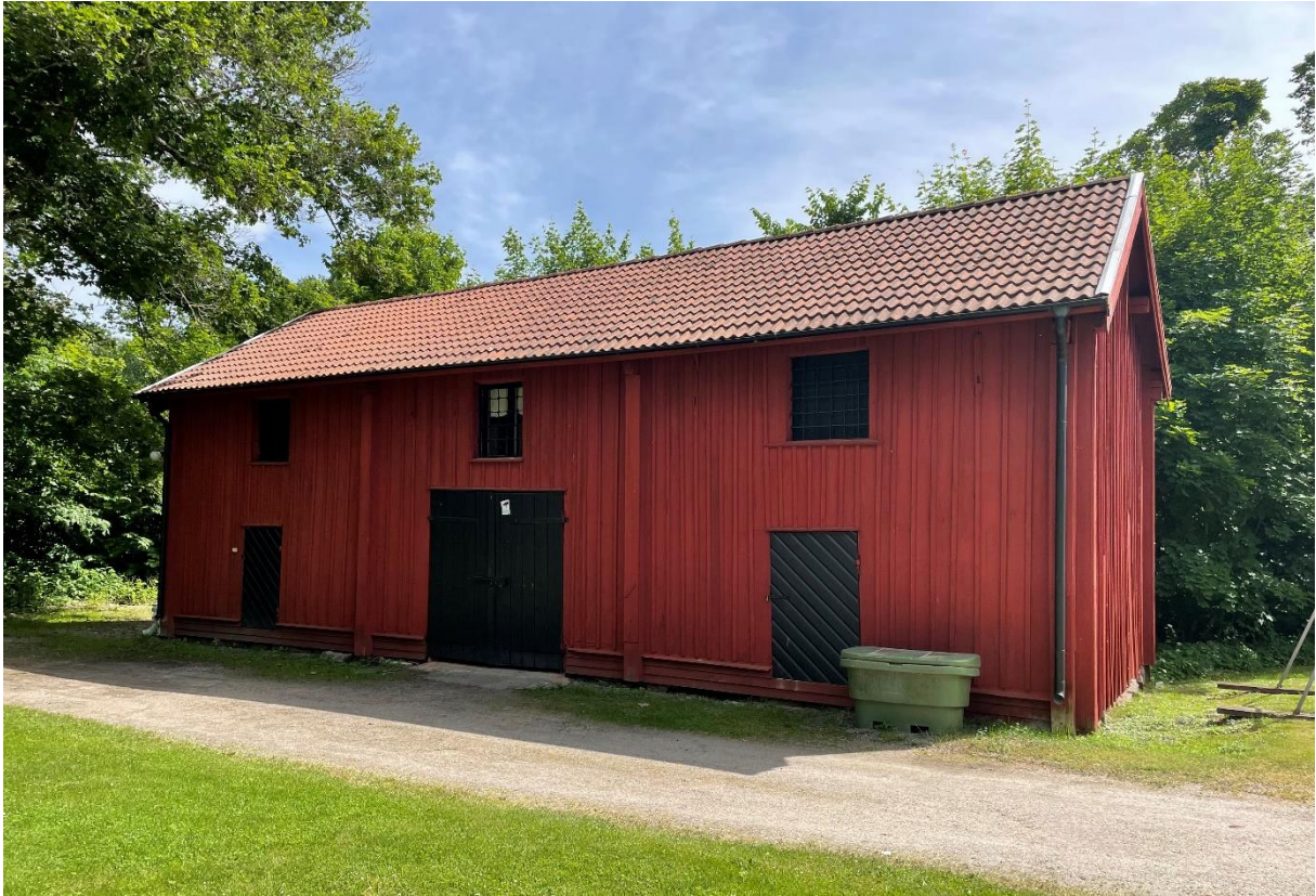
Stall/bod tidigare tillhörande prästgården.