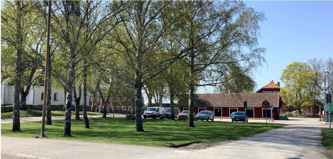
Parkering med före detta kyrkstall.