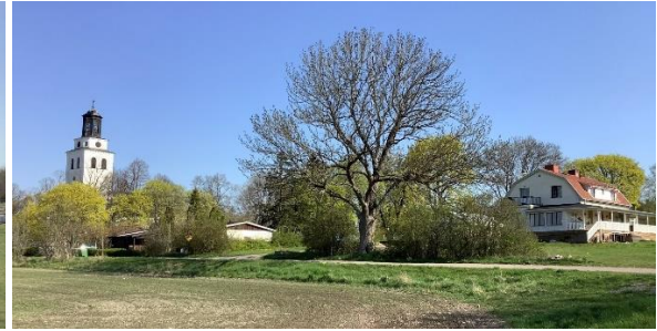
Kyrka med den yngre före detta prästgården till höger.