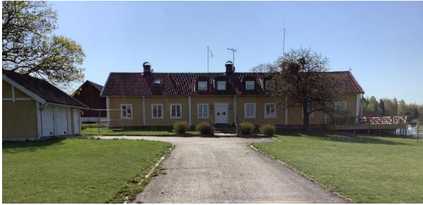
Före detta prästgård