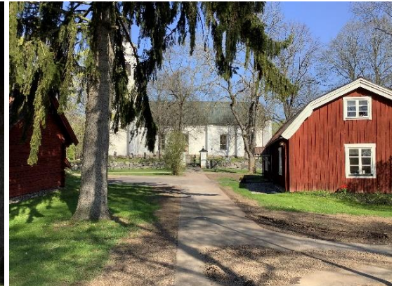
Gräsyta med träd väg från kyrkan upp till f.d. Prästgård. Vy från f.d. prästgård mot kyrka och nuvarande församlingshem.