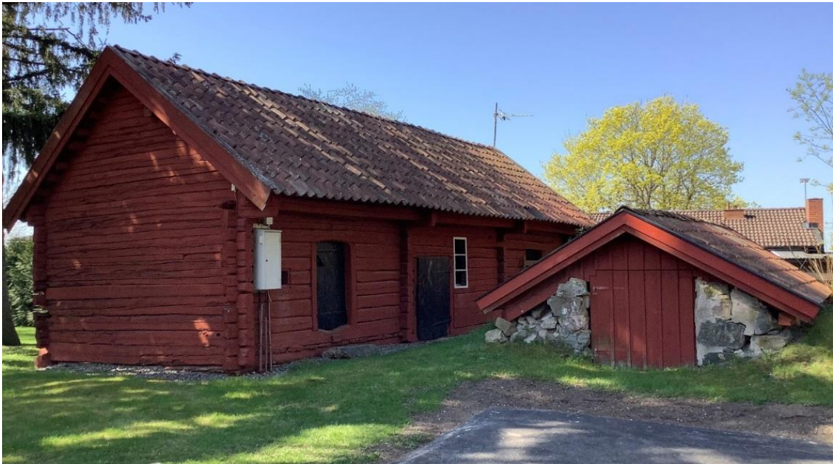
Äldre ekonomibyggnader (möjligen 1600-tal).