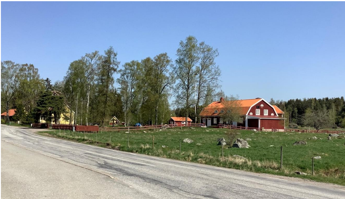
Bygdegård nordöst om kyrkan.