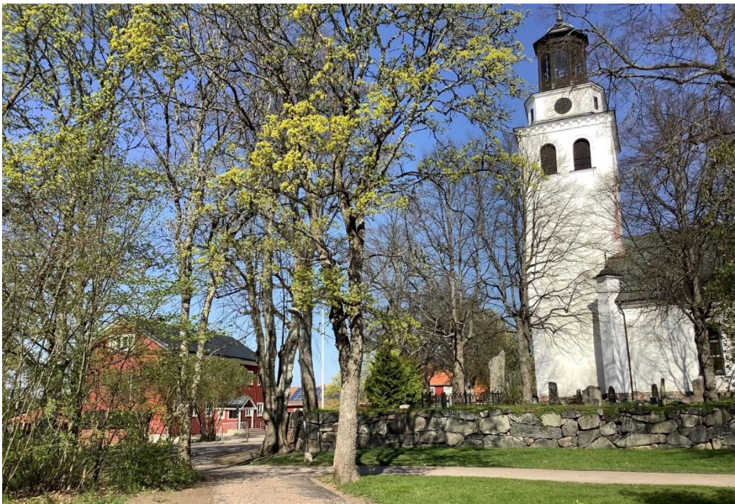
Dingtuna kyrka och skola