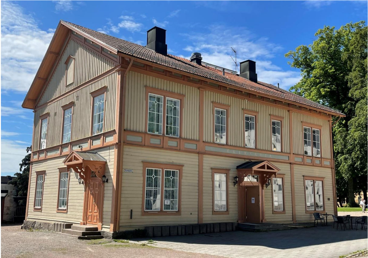
Före detta kyrkskola, idag fritidsgård.