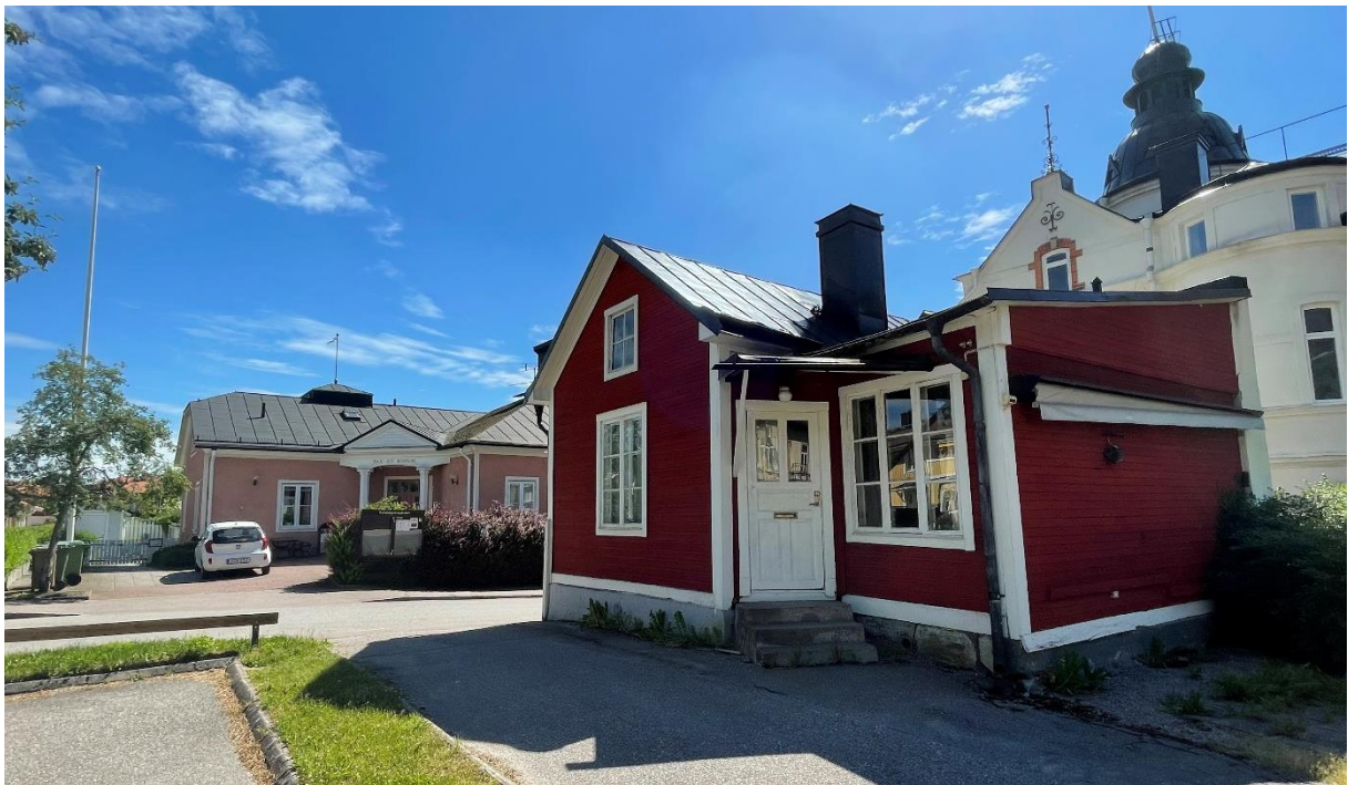
Äldre kvartersbebyggelse med församlingshemmet i rosa puts bakom.