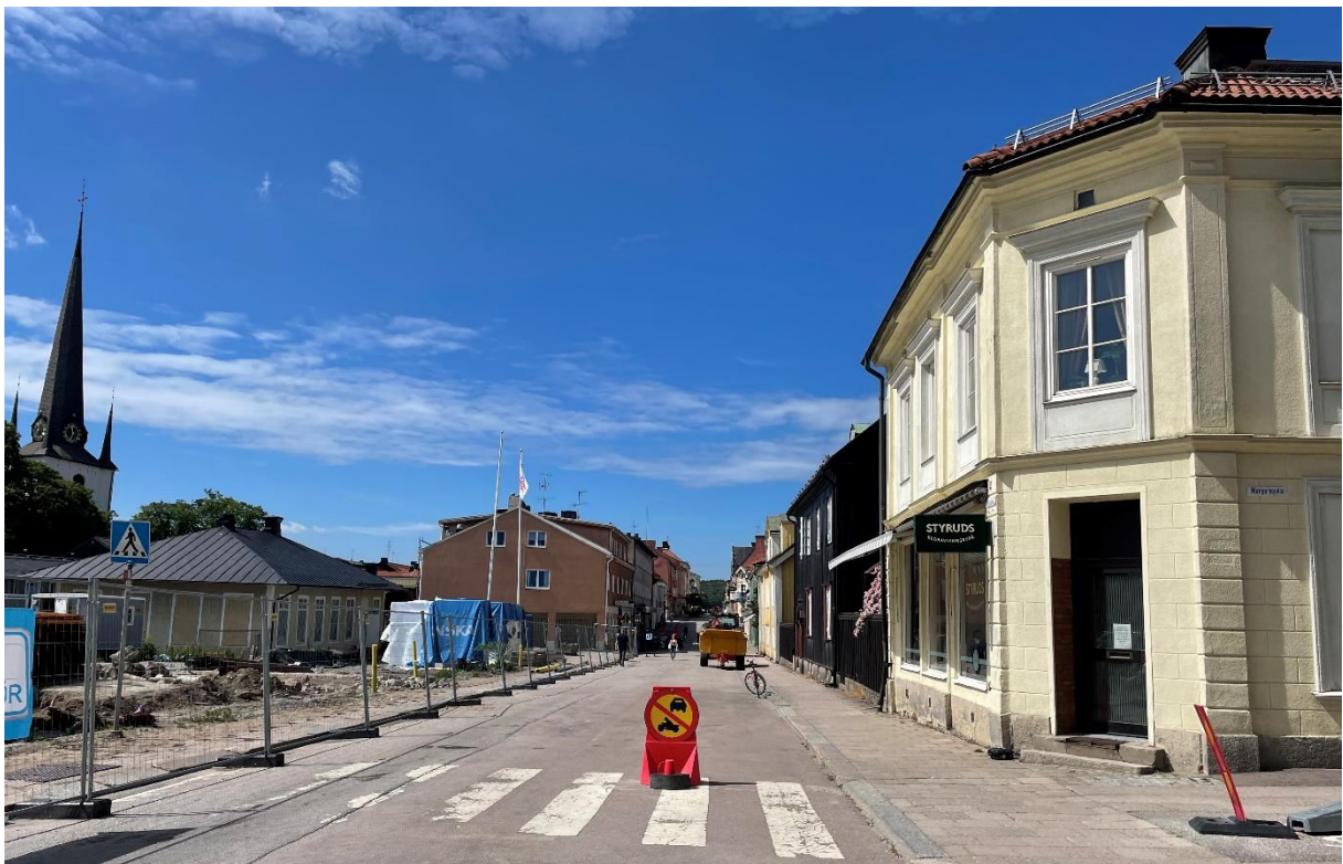
Vy längs Nygatan norr om kyrkan.