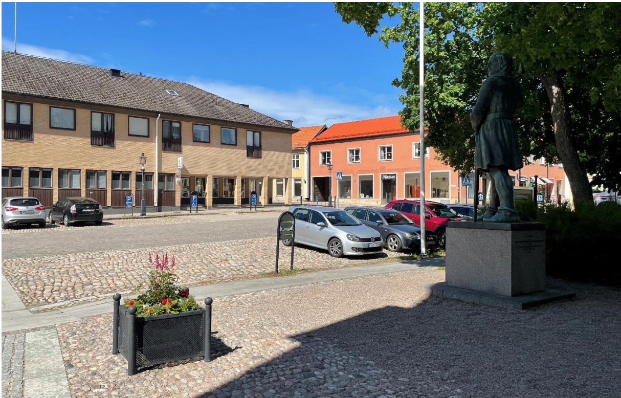
Vy från kyrkans entré.