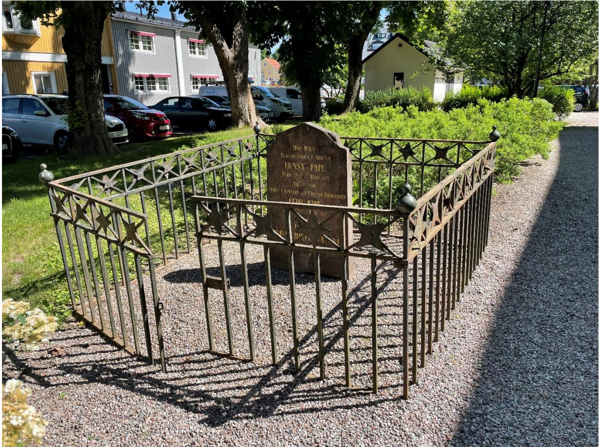
Enda graven kvar från den tidigare kyrkogården kring kyrkan.