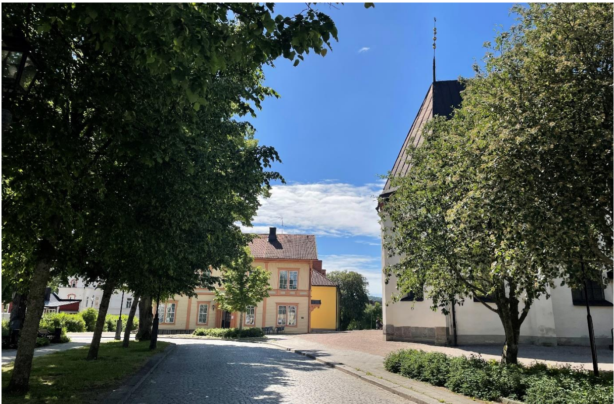
Kyrka och före detta kyrkskola från norr.