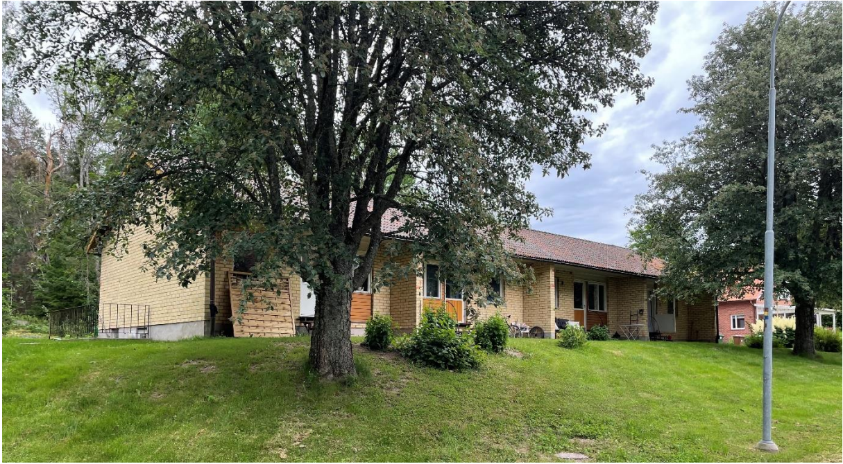
Före detta pensionärlägenheter.