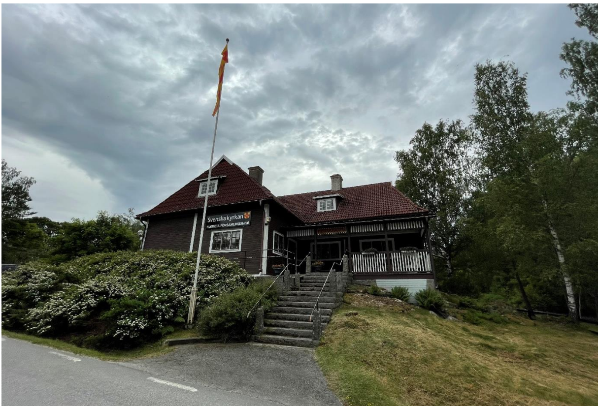
Församlingshemmet från 1912.