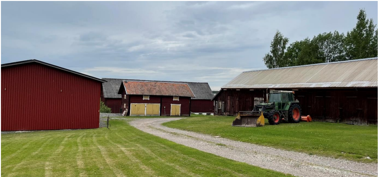
Ekonomibyggnader vid före detta prästgården.