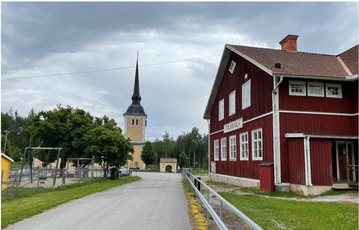
Himmeta kyrka och skolbyggnad.