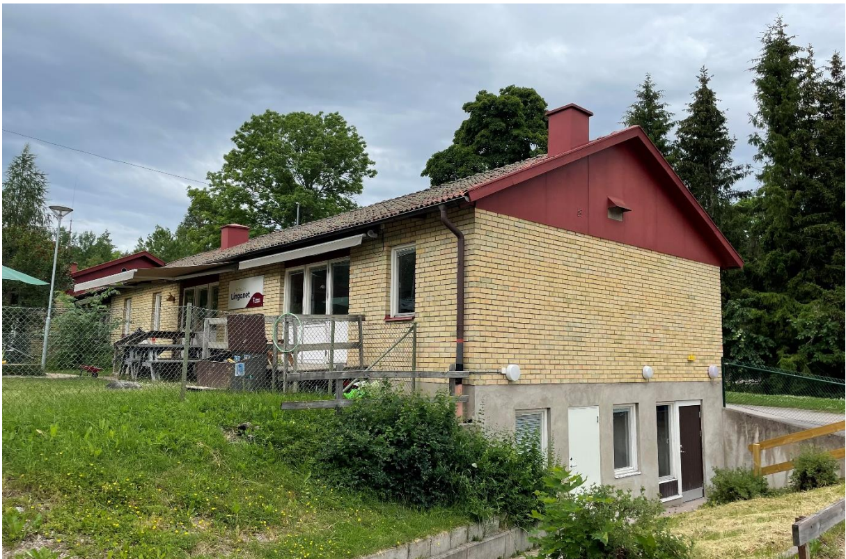
Bostadshus vid kyrkan, idag förskola.