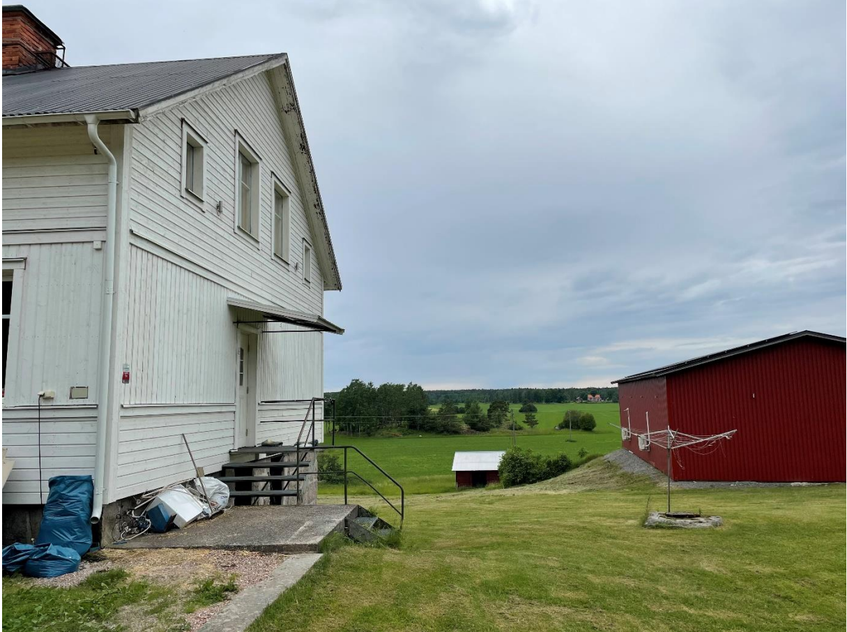
Före detta prästgård.