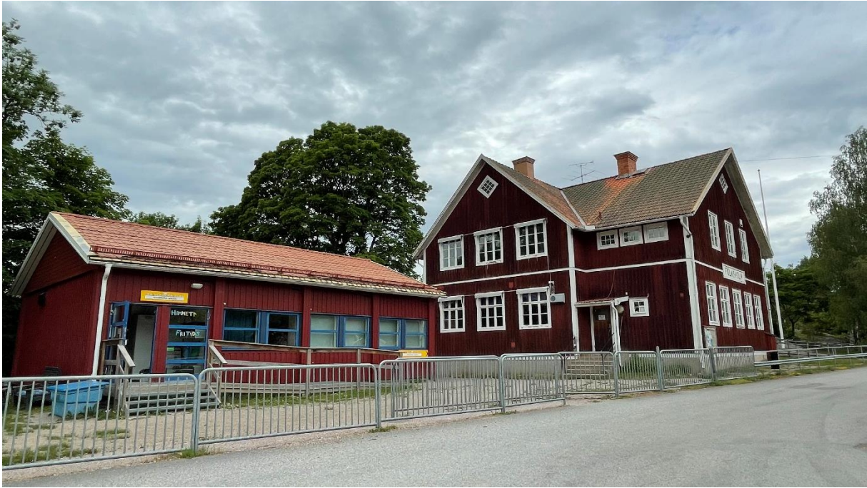
Skolbyggnad med annex.