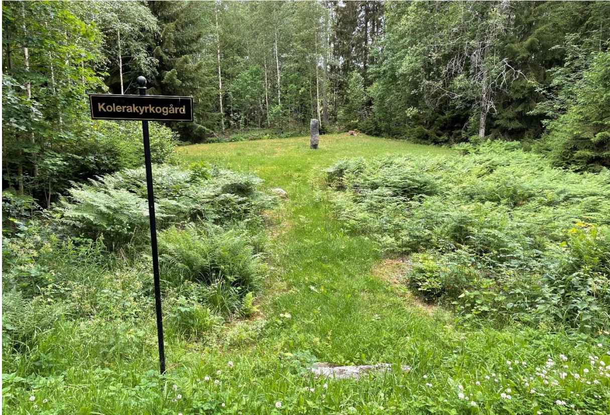
Kolerakyrkogård norr om prästgården.