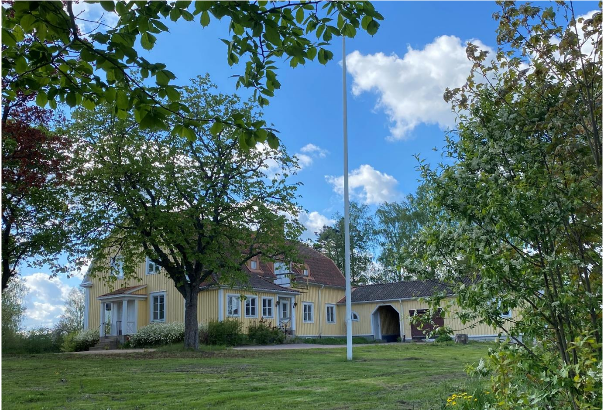
Kolbäcks före detta prästgård från 1922.