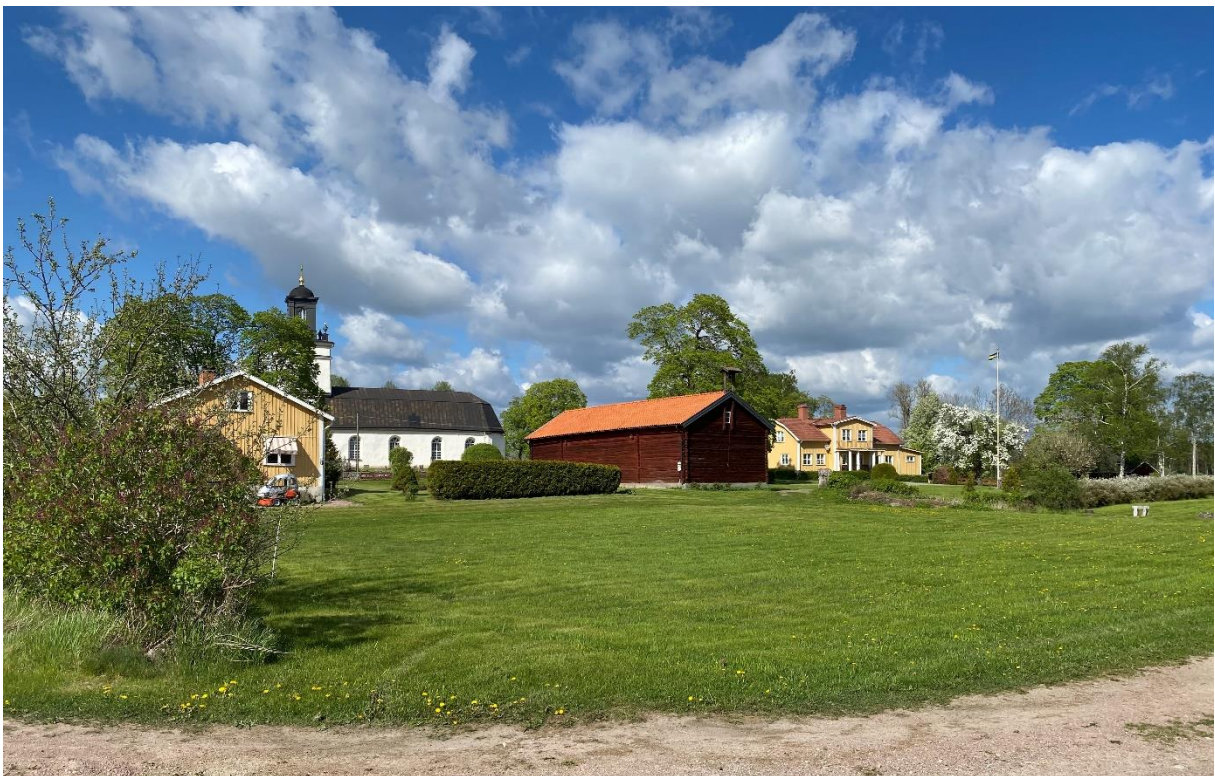
Kolbäcks kyrka med rester av Kyrkbyns jordbruksbebyggelse.