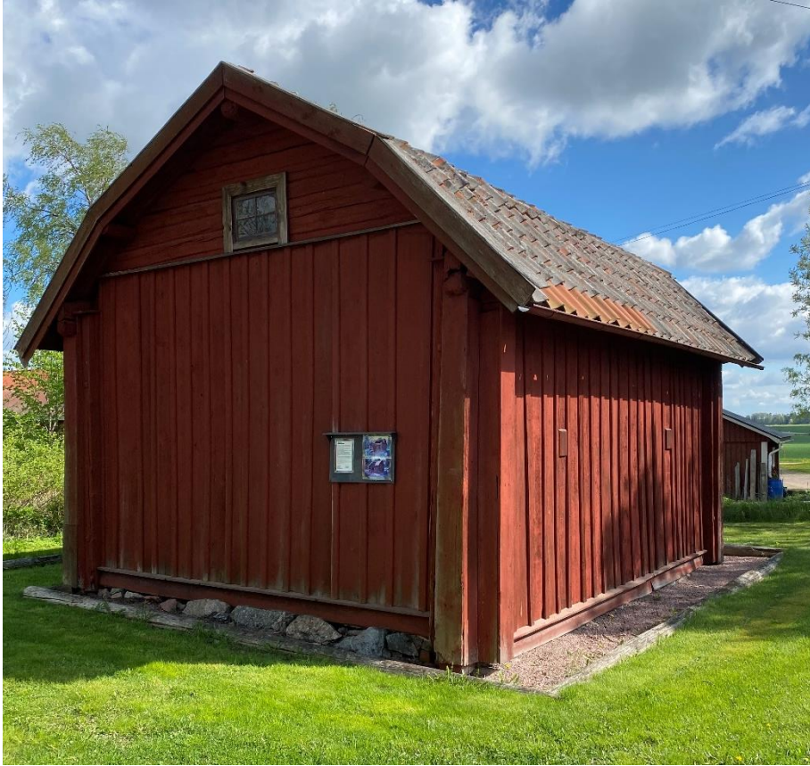
Före detta tiondebod.