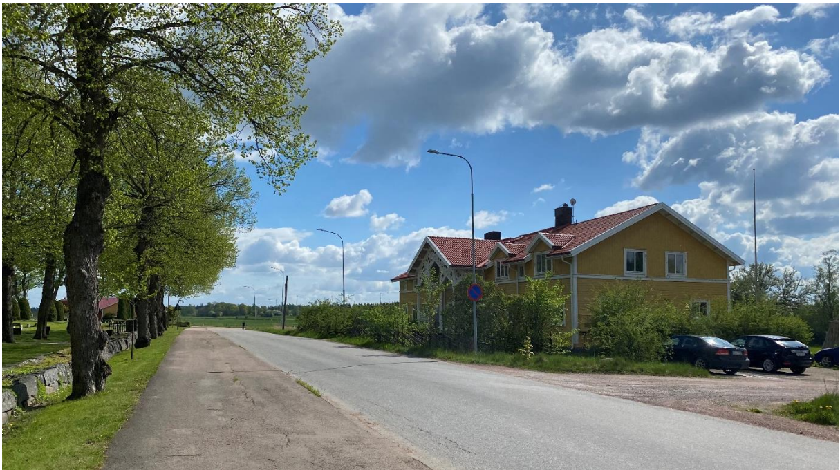
Före detta skolbyggnad.